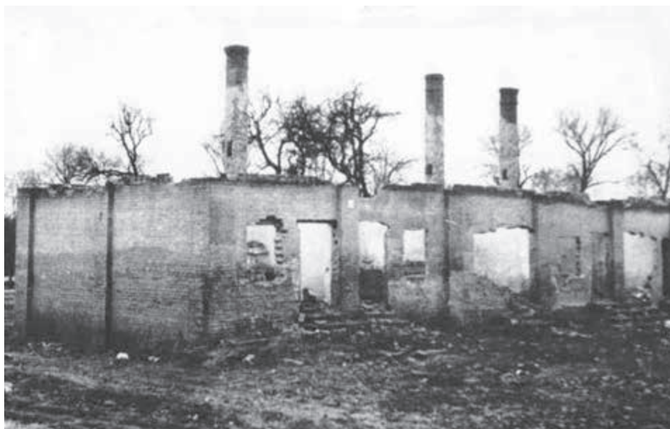
Trosky komínov v Komárne.