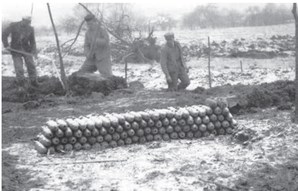
Civilni minéri pri práci.