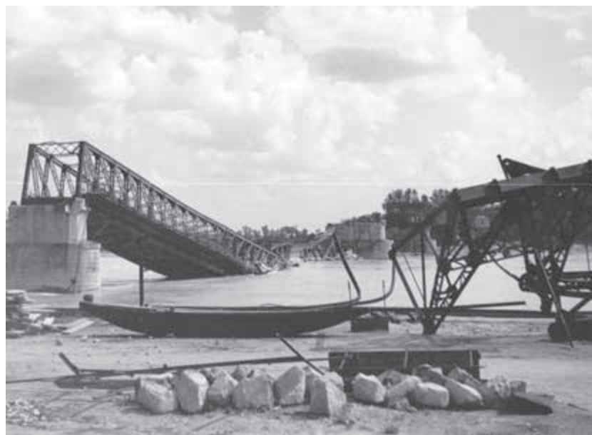
Starý most v Bratislave po odchode Nemcov.