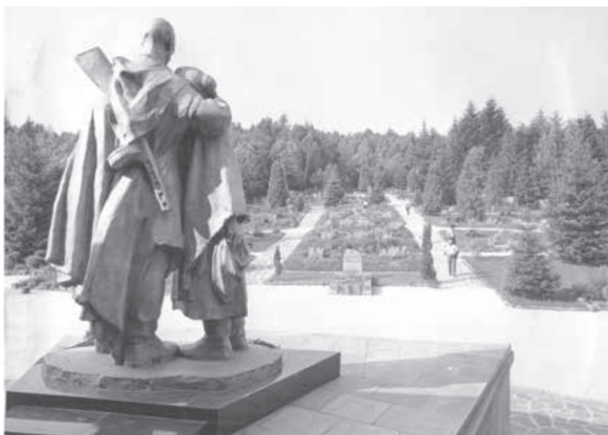
Památník na Dukle.