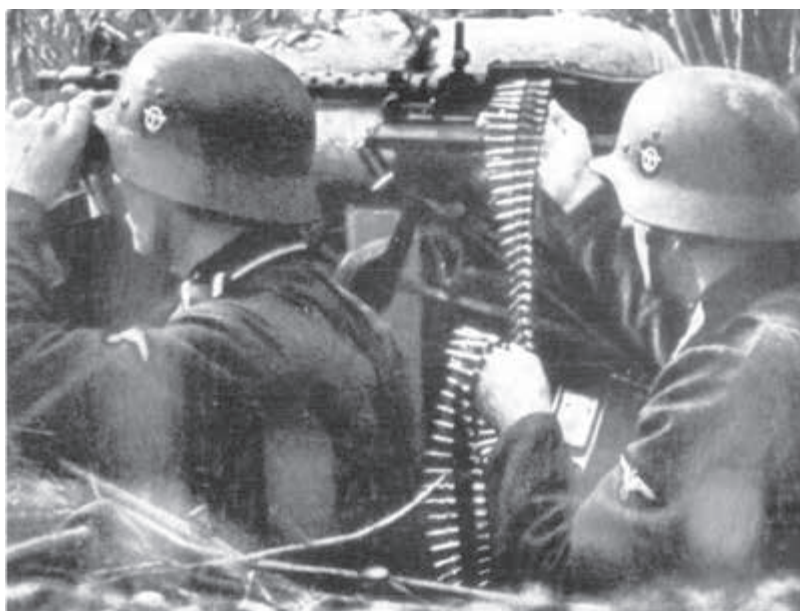
Nemeckí guľometčiaci v bojoch na Dukle v roku 1944.