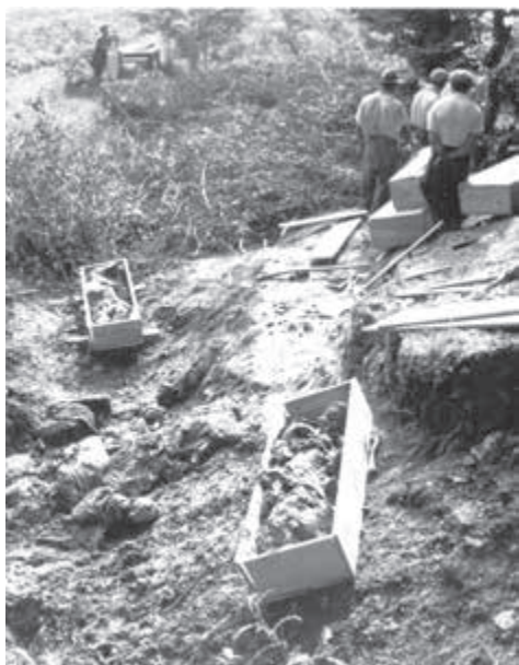
Otvorenie masových hrobov v Kremničke pri Banskej Bystrici.