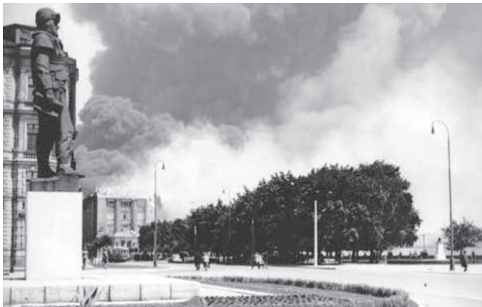
Vajanského nábrežie Bratislava. Zdroj-Vojenský historický archív Bratislava