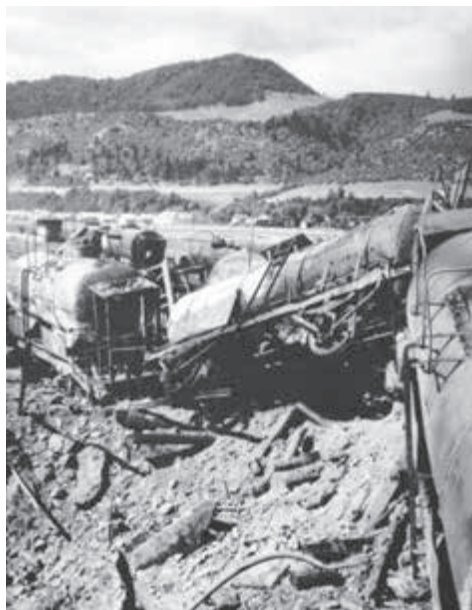
Vagony s palivom rafinéria Dubová.