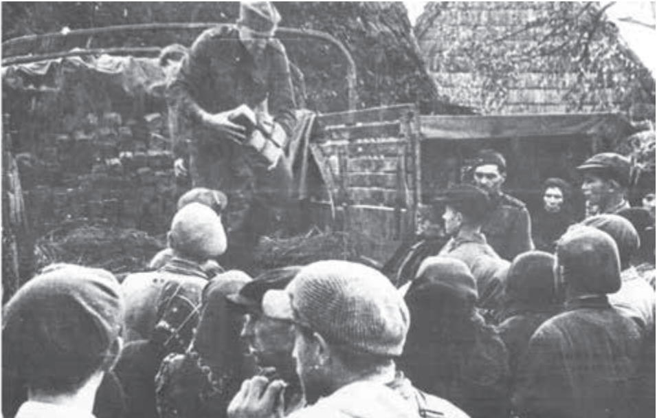
Čs. vojaci rozdeľujú chlieb obyvateľstvu v obci Čertižné.