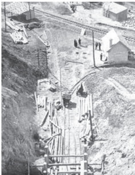
Rekonštrukcia ľahanovského tunela pri Košiciach.