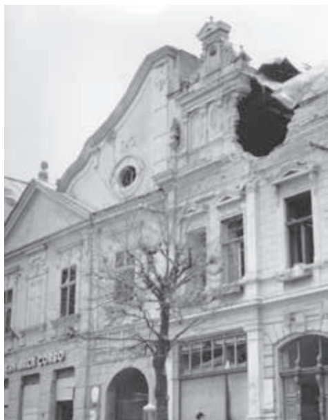
Známa kaviareň Korzo v Prešove po bombardovaní.