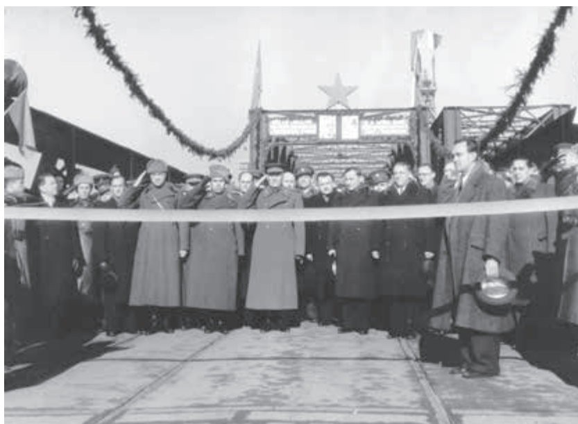
Slavnostné otvorenie mostu cez Dunaj.