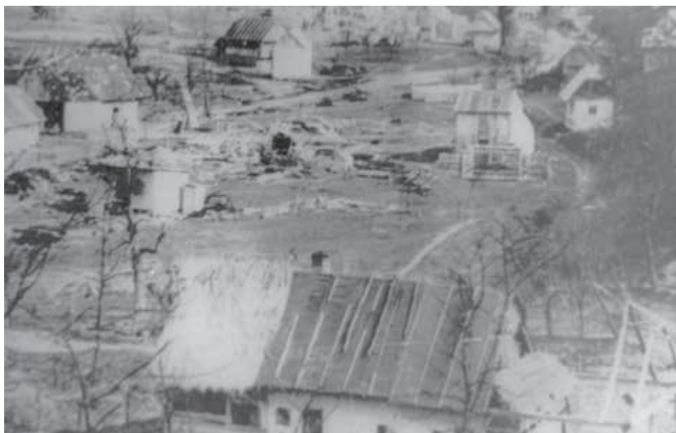
Nižná Pisaná v okrese Svidník po ústupe Nemcov.