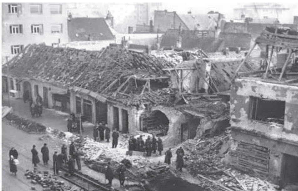
Dnešná Obchodná ulica v Bratislave.