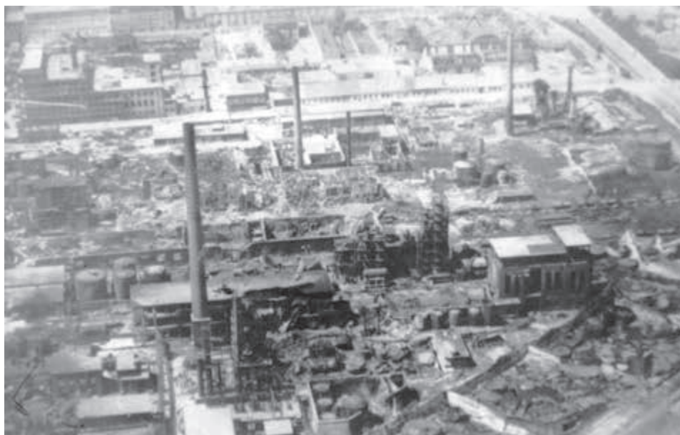
Vybombardovaná rafinéria APOLLO.