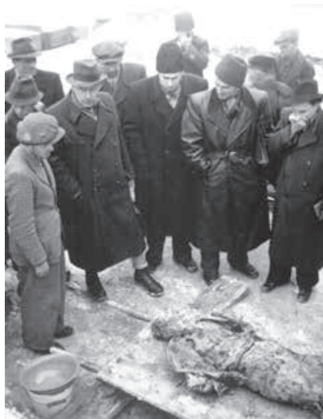
Exhumácia masových hrobov v Zemianských Kostoľanoch.