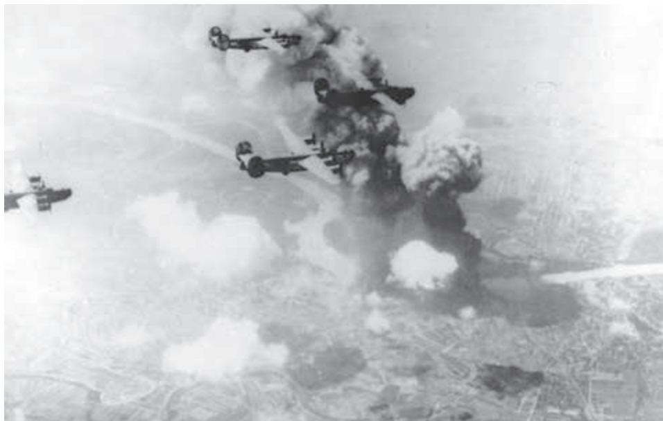
Nálet anglo-amerického letectva na rafineriu APOLLO.