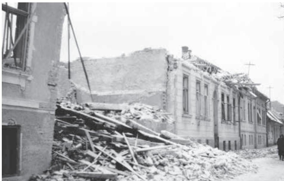
Zničený Prešov. Zdroj-Vojenský historický archív Bratislava