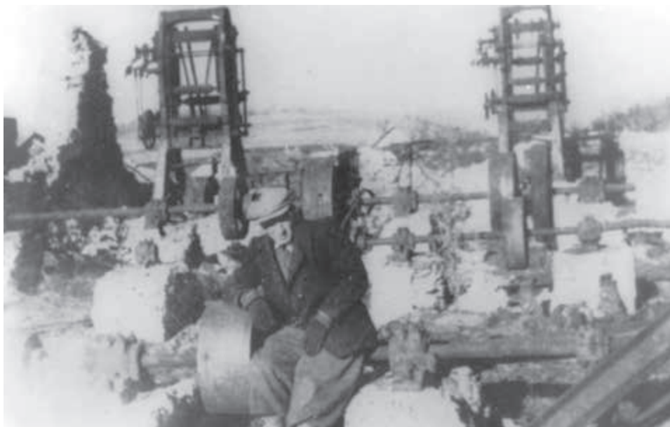
Vypalená parná píla.