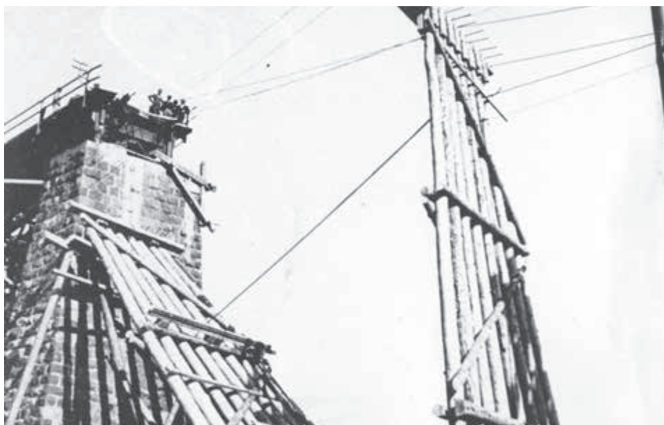
Obnová handlosvkého viaduktu.