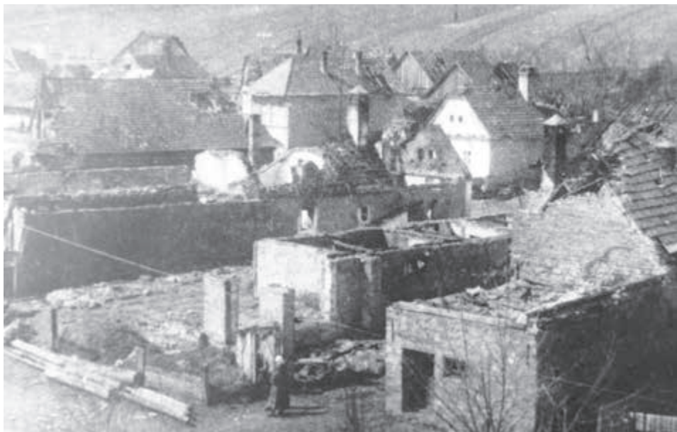
Ľanovo pri Liptovskom Mikulaši kde sa odohrali ťažké boje.