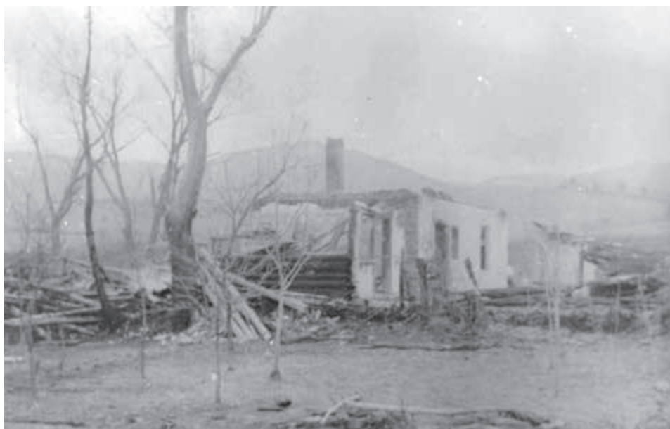
Vypalená Snina po prechode frontu.