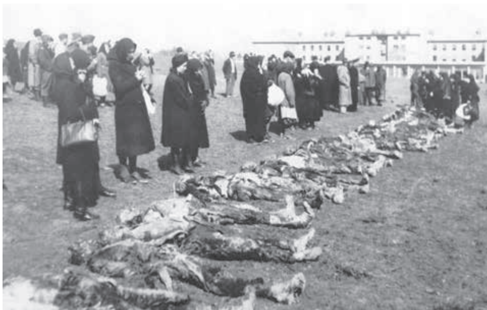
Identifikacia obeti v Partizánskom.