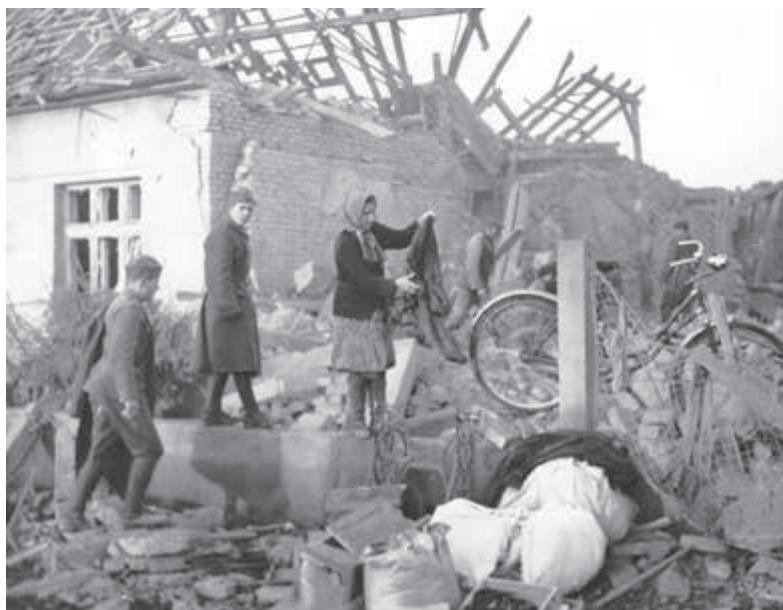
Skaza po prechode frontu.