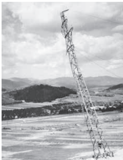
Zničené elektrické vedenie na Liptove.