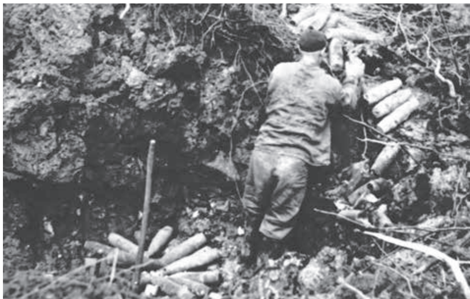
Munícia v okolí Dragova.