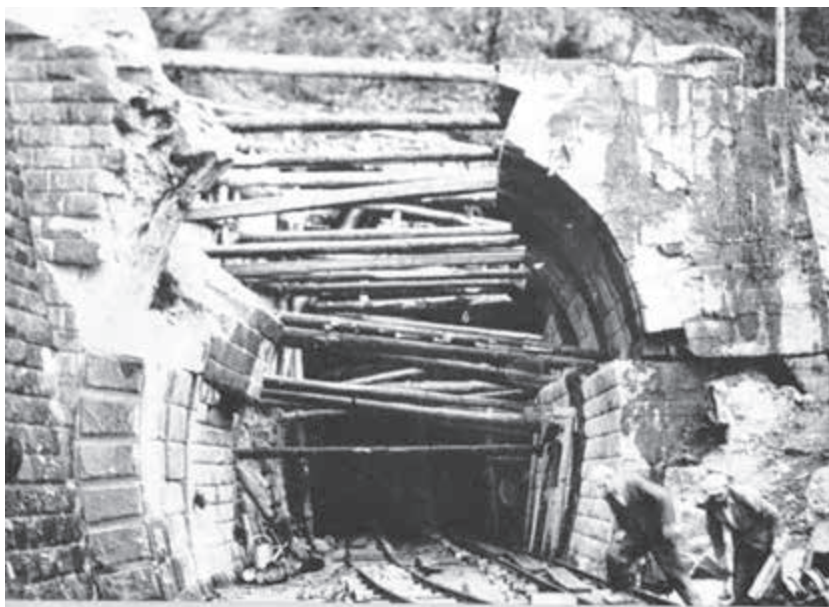
Zničený tunel.