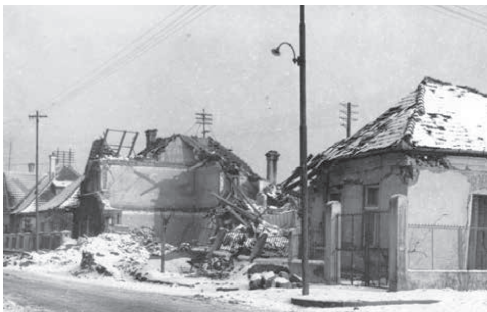
Nitra po januárovom bombardovaní 1945.