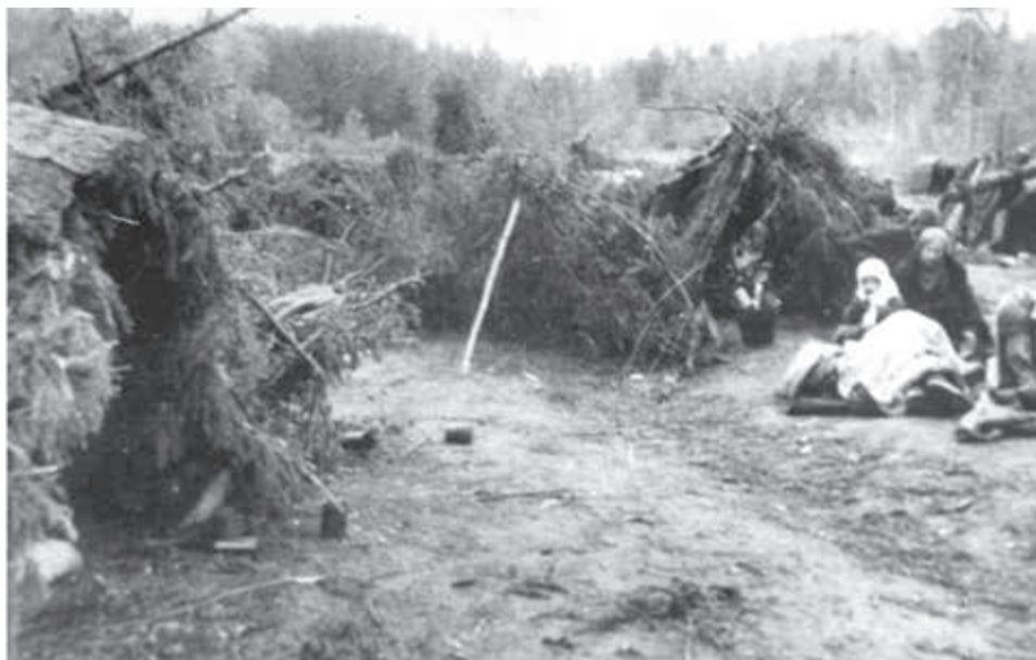
Po dobu ťažkých bojov pri Dukle sa skrývalo miestne obyvateľstvo v lesoch.