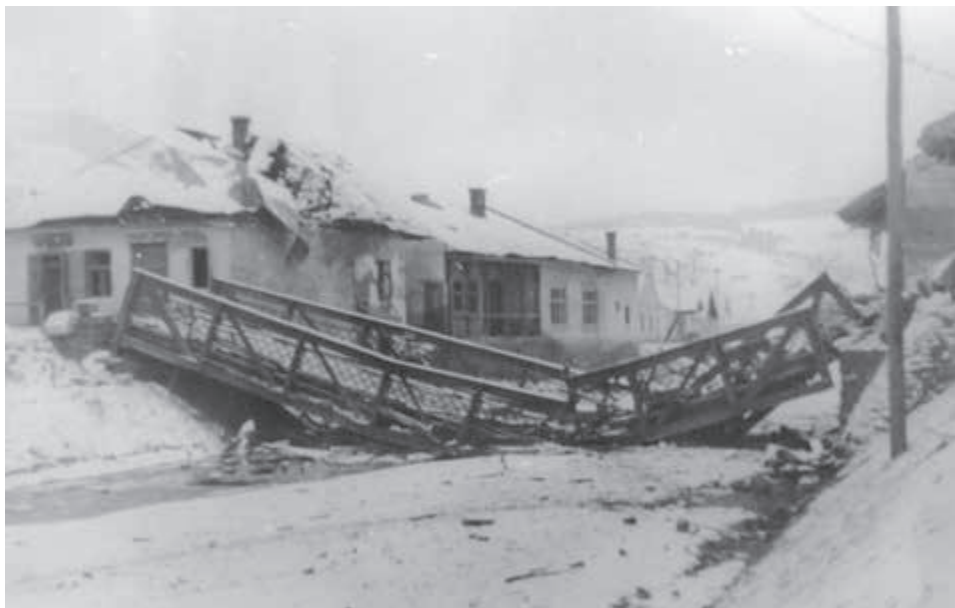
Obec Zborov v bardejovskom okrese po prechode frontu.