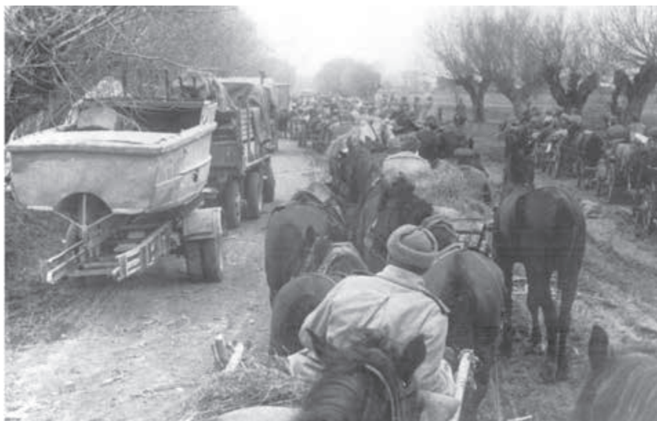
Oslobodzovanie ČSR. Jazdecké a ženijné oddiely II. ukrajinského frontu postupujú k Váhu pri postupe na Bratislavu.