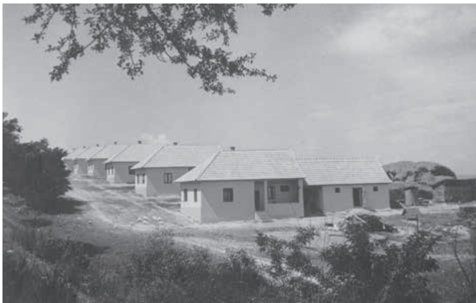
Nové domy na východnom Slovensku.