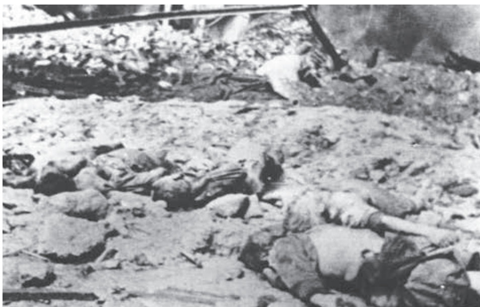
Pracovníci bratislavského prístavu ktorí nestihli utiec' pred anglo-americkým bombardovaním.