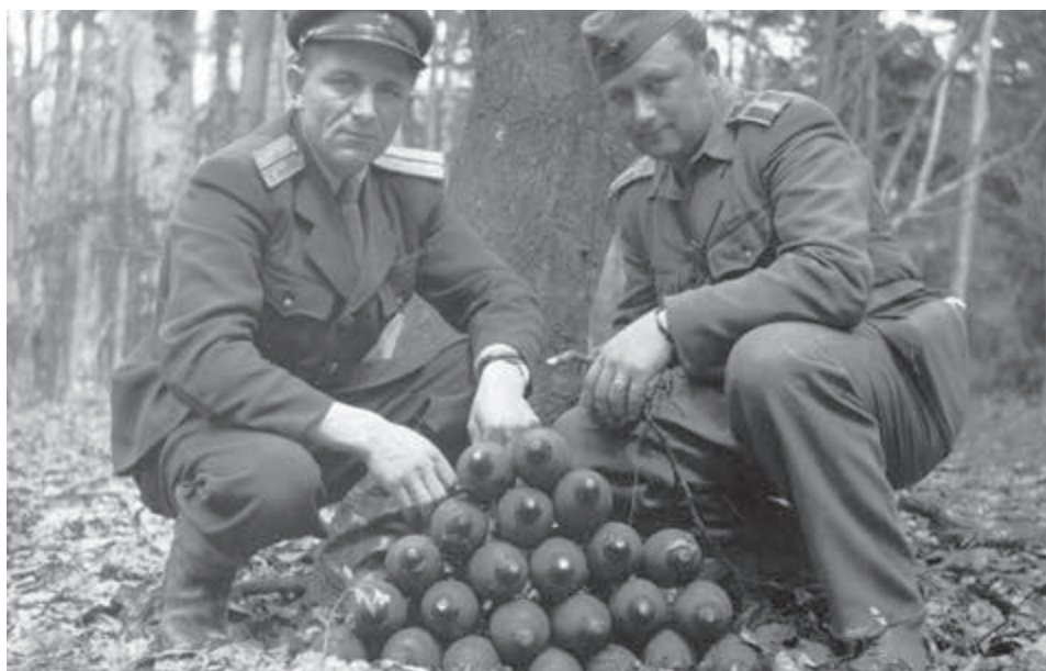
Vojenský pyrotechnici na Dukle.