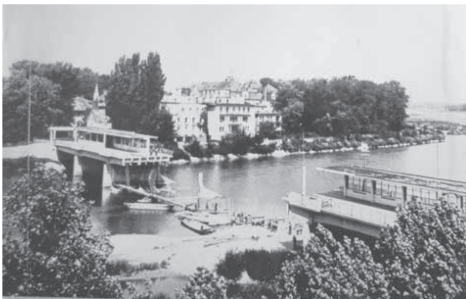
Kolonádový most v Piešťanoch po zničení ustupujúcimi nemeckými vojskami.