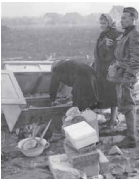
Ľudia si stihli odniesť zo zničených domov len základný majetok.