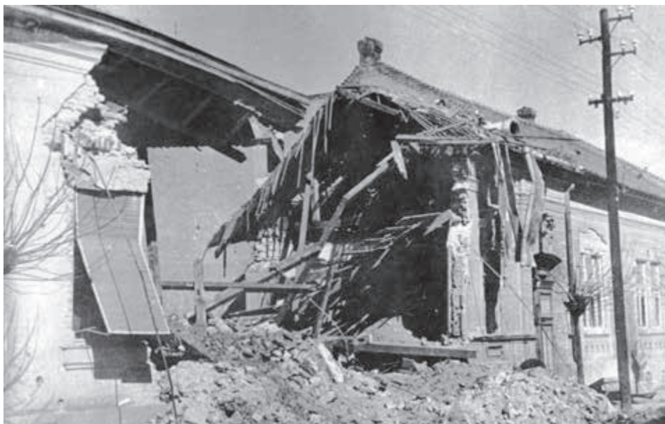
Banská Bystrica po prechode frontu.