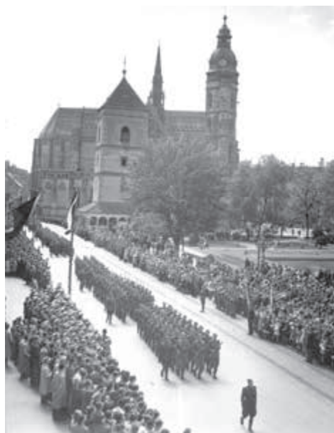
Prvé výročie oslobodenia Košíc v máji 1946.