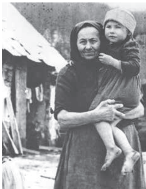
Obyvatelia pod Duklou 1945.