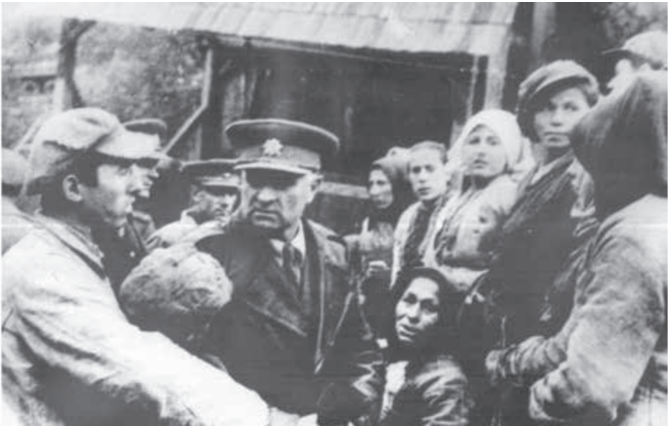
Generál L.Svoboda medzi miestnym obyvateľstvom vo Vyšnom Komárniku.