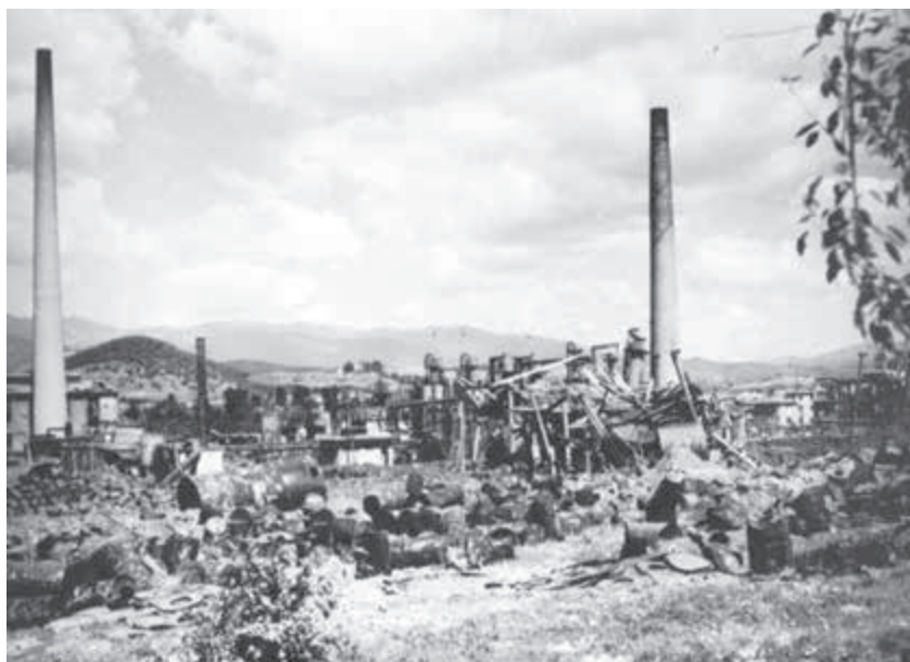
Rafinéria Dubová po náletoch.