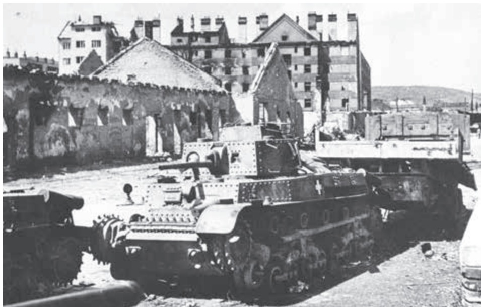
Zanechaná nemecká vojenská technika.