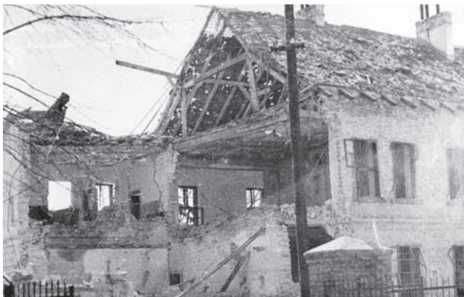
Zničené domy v Lučenci.