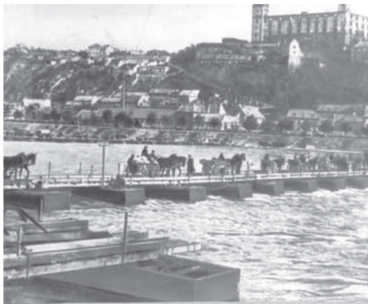
Provizorný most cez Dunaj v Bratislave postavený Červenou armádou.