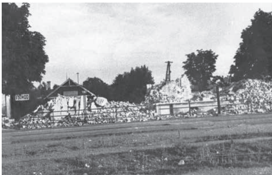
Trebišovská železničná stanica, kde prišli prvé dodávky UNNRA.