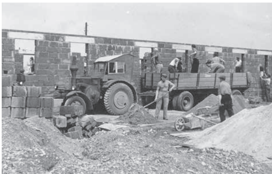
Rekonštrukčné práce vo vojnu zničených obciach.