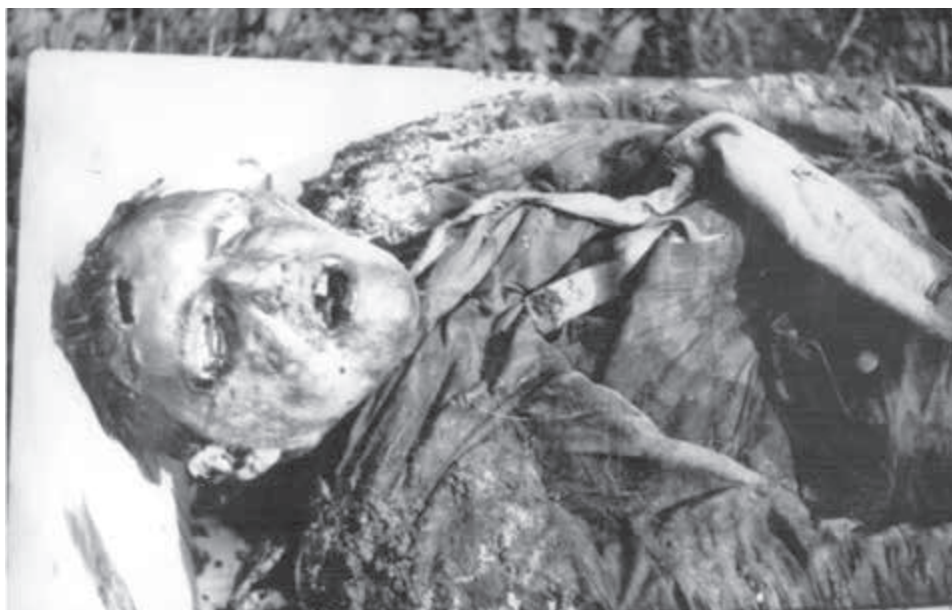
Strašným svedectvom zaobchádzania s povstaleckými vojakmi a partizánmi boli odkryté masové hroby. Zdroj-Vojenský historický archív Bratislava

Zdroj-Vojenský historický archív Bratislava