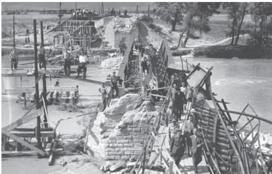
Rekonštručné práce na moste v Bratislava-Vrakuňa.