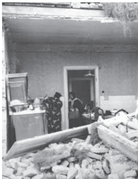
Mnohý ostali len holé životy.