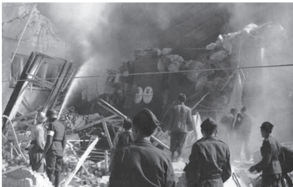
Nálet na Bratislavu zo septembra 1944.