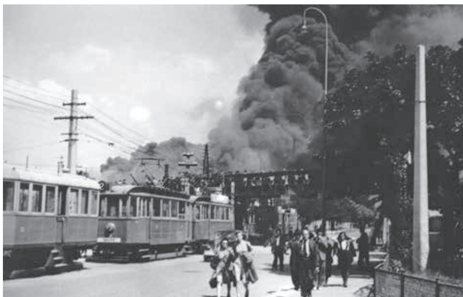
Nálet na Bratislavu z júna 1944.