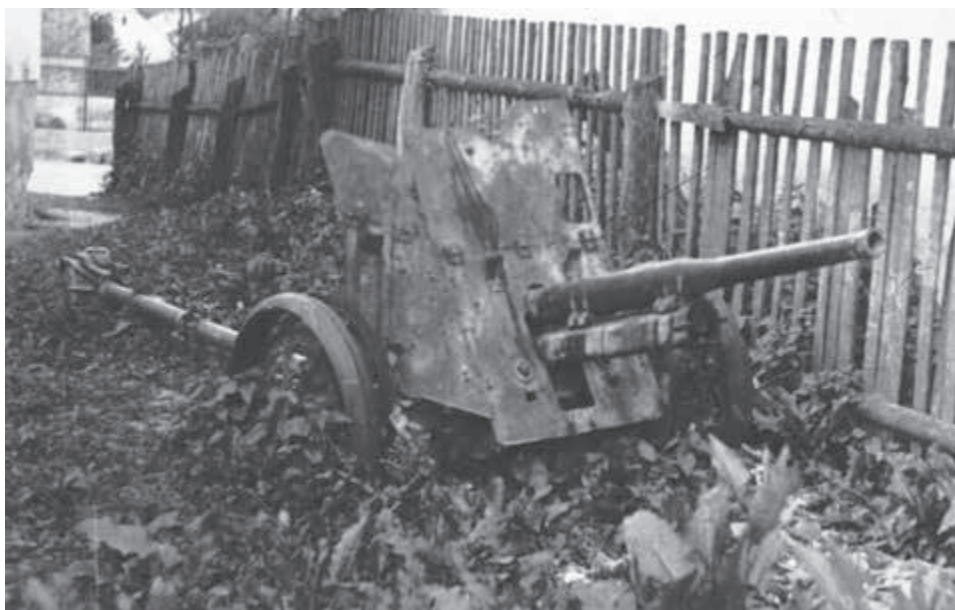
Nepotrebná vojenská technika po prechode frontu.