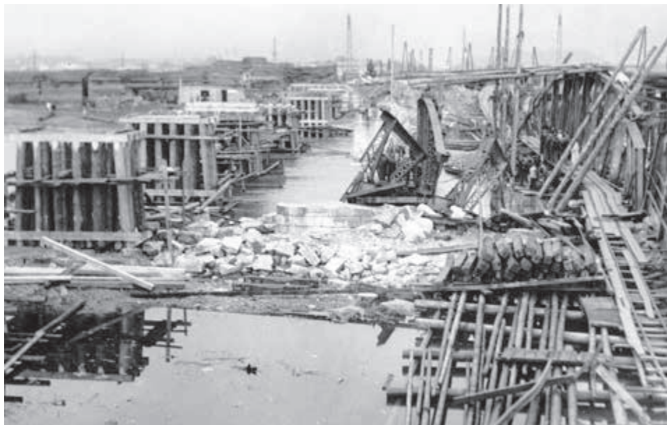
Zničený železničný most v Žiline.