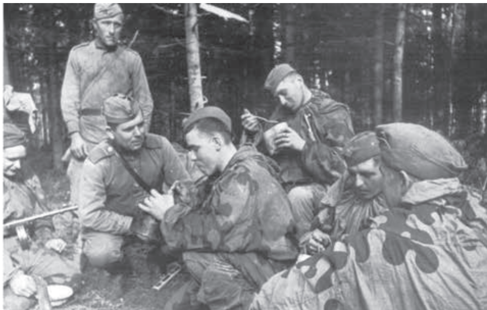
Príslušníci 1. čs. armádneho zboru v ZSSR počas karpatsko-duklianskej operácie v roku 1944.