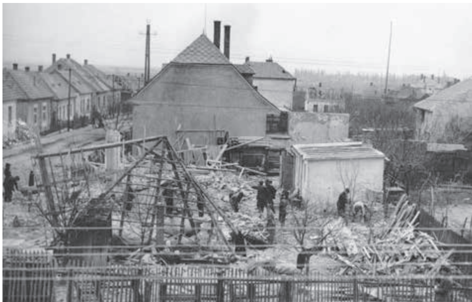
Bratislava-Rača po bombardovaní. Zdroj-Vojenský historický archív Bratislava