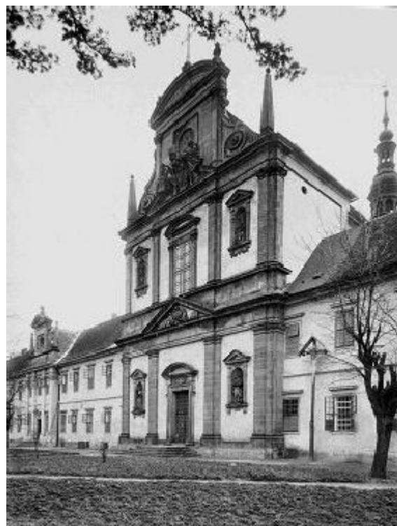
Chrám sv. Josefa

Mimo vedení trestnice, odborných a administrativních pracovníků, kterých bylo celkem 10, se staralo o přímý výkon trestu trestanců celkem 96 dozorců.