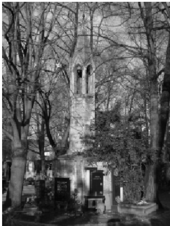
Bývalý vězeňský hřbitov dnes připomíná jen minaret

Zde našli poslední odpočinek ti, kteří zemřeli v pankrácké trestnici v důsledku nakažlivé nemoci nebo v letních měsících, popř. ti, kteří si pohřeb předplatili. V ostatních případech byli zemřelí trestanci předáváni patologickému ústavu v Praze k pitevním účelům. 16 Do vězeňského oddělení hřbitova se vcházelo od silnice na západní straně a stopy po tomto vchodu jsou dodnes patrné. Pohřby se konaly bez přítomnosti příbuzných a známých, neboť těla zemřelých nebyla rodině v té době vydávána.