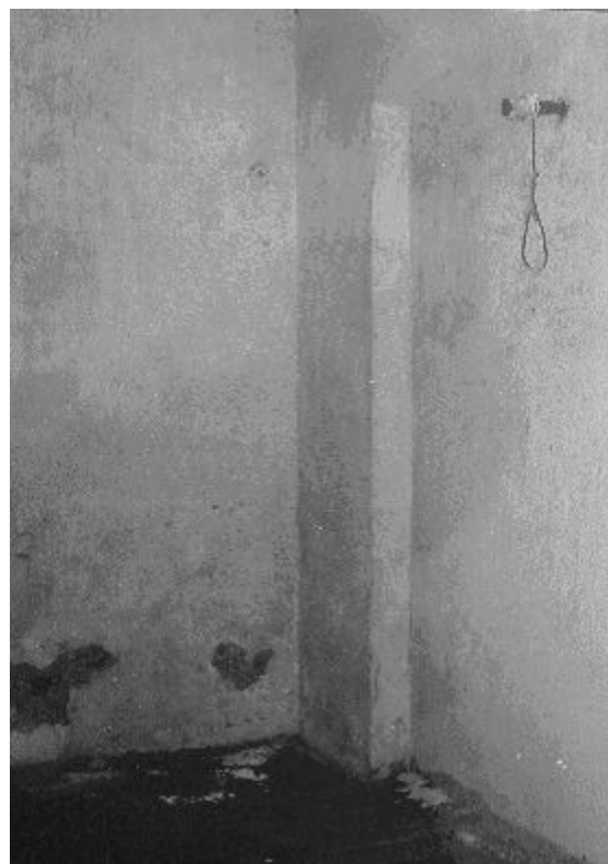
Pankrácké popravistiště, kde byly vykonány poslední popravy

Pečlivě připravený program sestával ze tří částí: