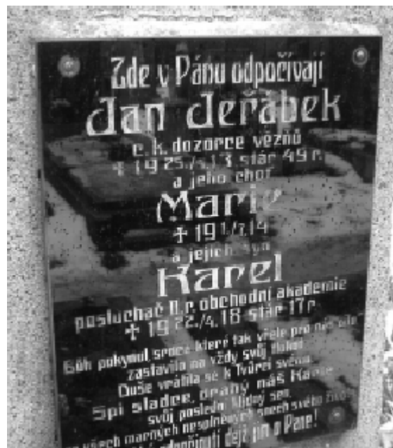
Náhrobní deska bývalého dozorce pankrácké věznice

Jeho další existenci začalo ministerstvo spravedlnosti řešit v roce 1920, a to jednak na základě iniciativy poslance Emila Špatného, jednak snahou „Správní rady společného hřbitova farních osad Michle a Nuslí“ o převzetí do vlastnictví obce, která se tak snažila vyřešit kritický nedostatek volného místa pro nové hroby na obecním hřbitově.