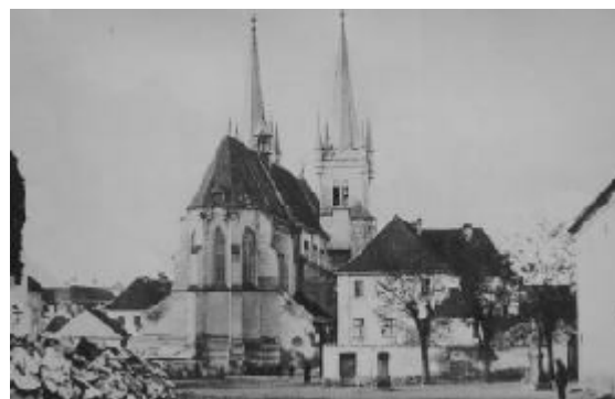
Staré děkanství bylo zbouráno i se šatlavou

V 18. století je ve městě doloženo ukládání trestu tzv. veřejně prospěšných prací. Vzhledem k tomu, že čistota byla ve městech problematickou otázkou od dob jejich zakládání až do zavádění kanalizace a někde i déle, museli chrudimští provinilci jako součást trestu čistit ulice. Z roku 1720 je znám případ zloděje obilí, jenž musel „ přikovaný ke kolečku ty rummy na rynku tři dny odklízet “. K takovýmto trestům nebyly ovšem odsuzováni pouze zloději. Podobně dopadla i žena živící se prostitucí, vyslechla si rozsudek, že „ po osm dní rynek pucovat má “. Roku 1786 si měšťan Všeťka za 13 zlatých 30 krejcarů ročně od magistrátu pronajal hnůj z rynku, stal se z něj „ nájemník hnoje rynekovního “. K smetání byli opět určeni vězni, nájemník si však musel hnůj včas odvézt, neboť jak vyplývá z jeho stížností, chodili si na rynek přimetat i další měšťané.