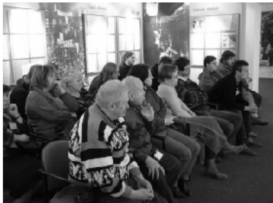
Diskuse v Památníku o Nadaci pro vyrovnání se s minulostí zaujala všechny přítomné.