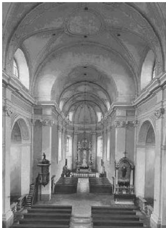
Vnitřek chrámu sv. Josefa

Objekt věznice je v současné době považován za památku 1. kategorie a Vězeňská služba ČR vynakládá veliké úsilí na obnovu kostela, který byl v roce 1953 vystěhován do okolních farností. Ostatky Albrechta Václava Eusebia z Valdštejna pak byly převezeny a uloženy na zámku v Mnichově Hradišti. V prostorách kostela pak bylo vybudováno pracoviště ve třech podlažích, na kterém pracovalo na 200 vězňů.