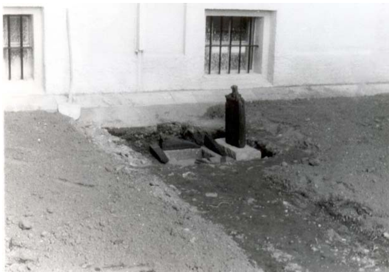
Popraviště za vězeňskou nemocnicí