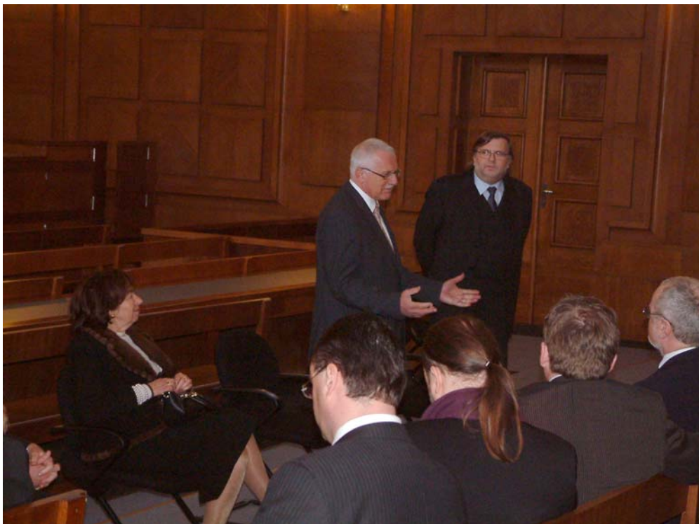
Rozhovor se soudci ve Velké porotní síni Vrchního soudu v Praze