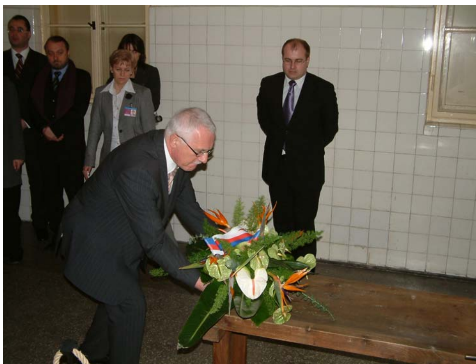
Prezident Václav Klaus pokládá kytici ke gilotině