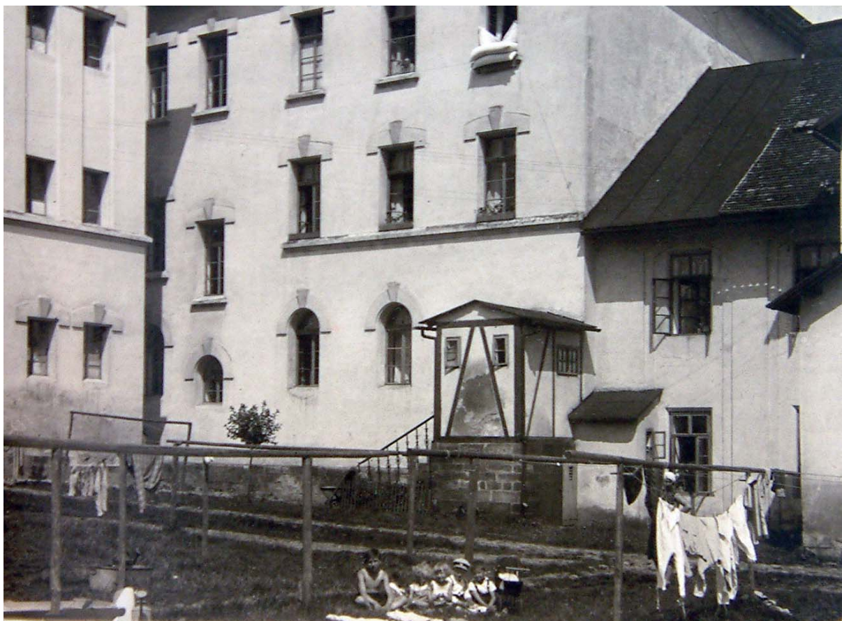
Kolonie vězeňských dozorců (fotoarchiv věznice Valdice)