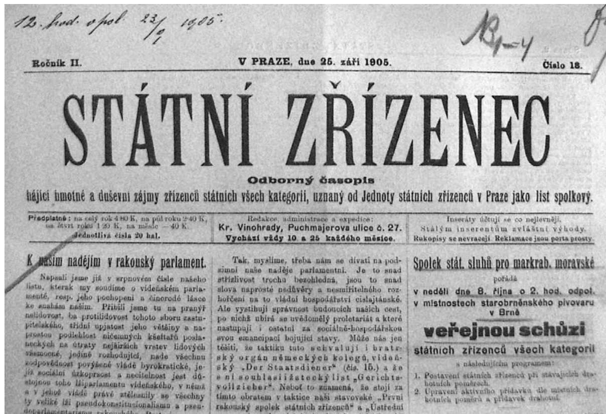
Odborový časopis Státní zřízenec

Vybrané příspěvky z tohoto časopisu, které budou na pokračování otištěny, seznámí čtenáře se zajímavými fakty z činnosti rakouské justice a přiblíží problémy, které řešili naši předchůdci před sto lety.