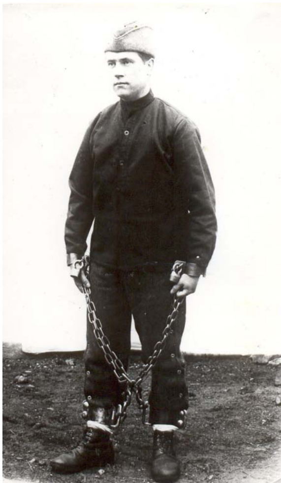
Poutání vězně k eskortě na počátku 20. století