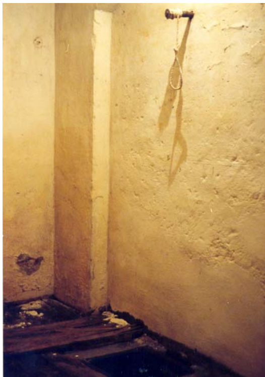
Popraviště v suterénu administrativní budovy

Na základě rozhodnutí Politického sekretariátu ÚV KSČ v roce 1954 zaniklo popraviště za vězeňskou nemocnicí a bylo vybudováno nové v suterénu pravé části čelního objektu věznice. Do jeho prostor se vcházelo z podzemní chodby, která spojovala pankráckou věznici s justičním palácem. Za vstupními dveřmi se nacházela místnost, vybavená stolkem a židlemi, kde zasedala komise, dohlížející nad výkonem trestu smrti, složená ze soudce, prokurátora, náčelníka věznice a lékaře. Z ní se vstupovalo do cely, která byla vybavena jednoduchým popravčím zařízením.