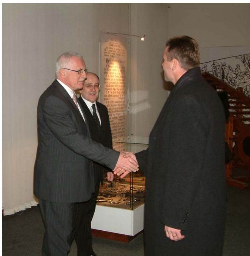
Setkání s generálním ředitelem VS ČR plk. Mgr.Ludškem Kulou