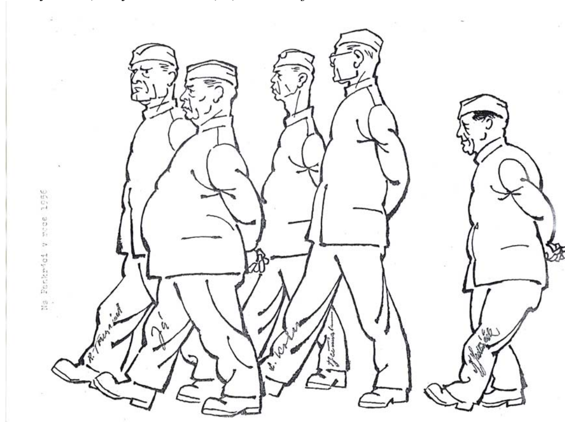
Skica akademického malíře Otakara Číly (Na Pankráci 1956)