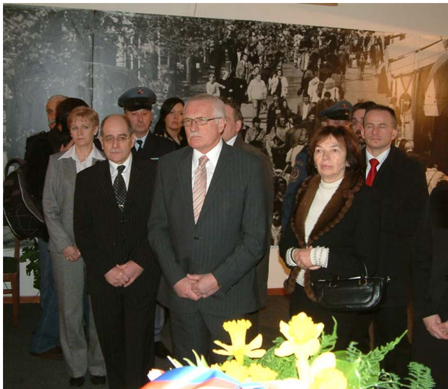
Prezidentský pár v pietní místnosti Památníku Pankrác