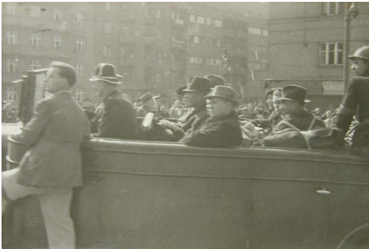
Eskorta zatčených členů protektorátních vlád do vyšetřovací vazby.