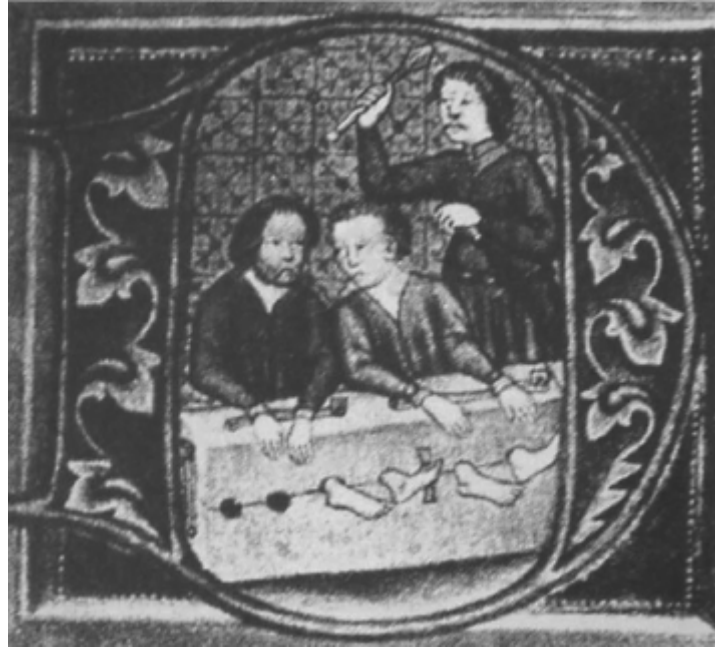
Použití tzv. klády v průběhu věznění (15. století)

byla uvnitř věznice častěji používána svěrací kazajka. V 50. letech 20. století došlo k návratu řetězových pout s koulí k zotření trestu odnětí svobody, zvláště u politických vězňů. V souladu s požadavky Standardních minimálních pravidel OSN pro zacházení s vězni byla od 60. let 20. století používána pouta s poutacím opaskem, zpravidla při eskortách a ke zklidnění agresivních vězňů poutací popruhy k upevnění na lůžku. Poutací prostředky se v průběhu svého vývoje staly nejen zdokonalovanou technickou pomůckou, ale též symbolem vězeňství a politické nesvobody.