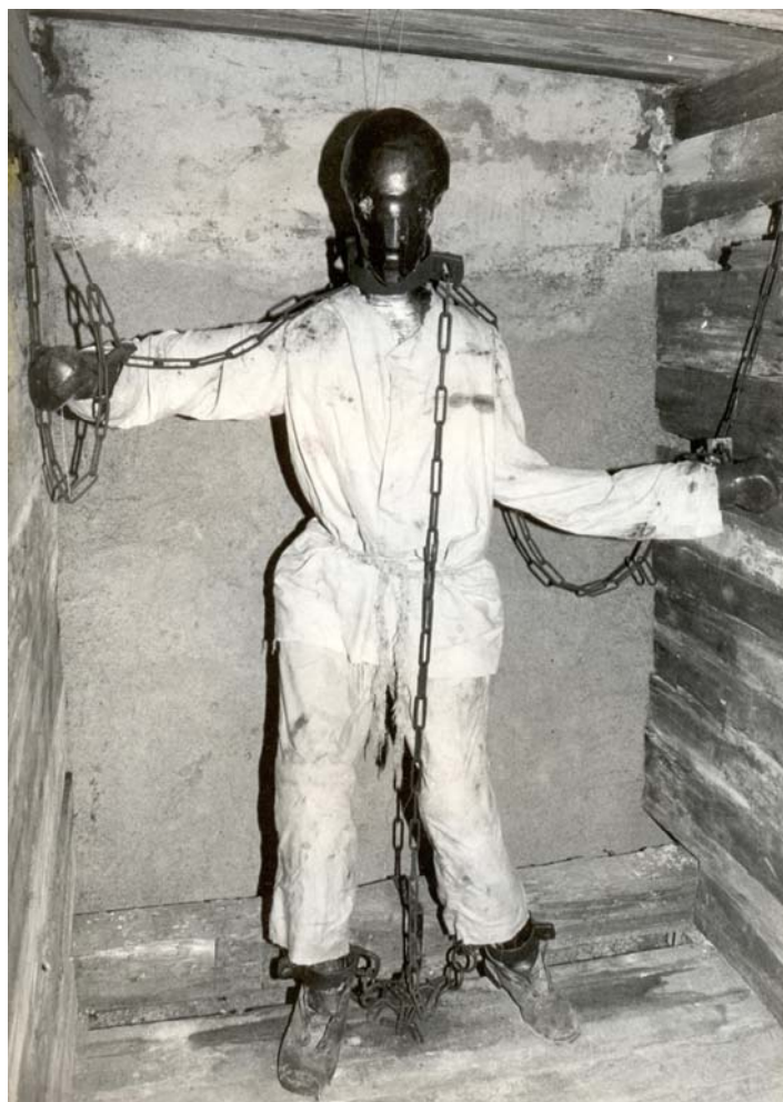
Způsob zakování doživotního vězně (18. století)