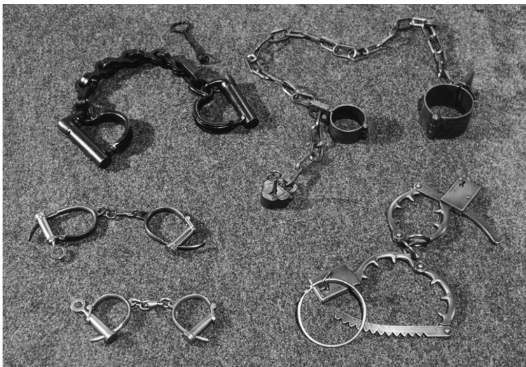
Pouta k překonání fyzického odporu a zamezení útěku (19. století)