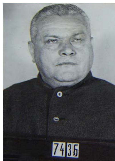
Ve výkonu trestu

V důsledku odsouzení byl též propuštěn ze služebního poměru z Kanceláře prezidenta republiky a zbaven úřadu univerzitního profesora právnické fakulty Masarykovy univerzity v Brně. Trest nastoupil 31.7.1946 ve 12.30 hod. pod základním číslem 7436, konec trestu stanoven na 12.5.1970 v 11.00 hodin. Po rozsudku setrval v pankrácké soudní věznici v trestní vazbě dalších 91 dní, a to v době od 1.8.1946 do 30.10.1946, kdy byl eskortován do trestnice pro muže v Plzni na Borech.