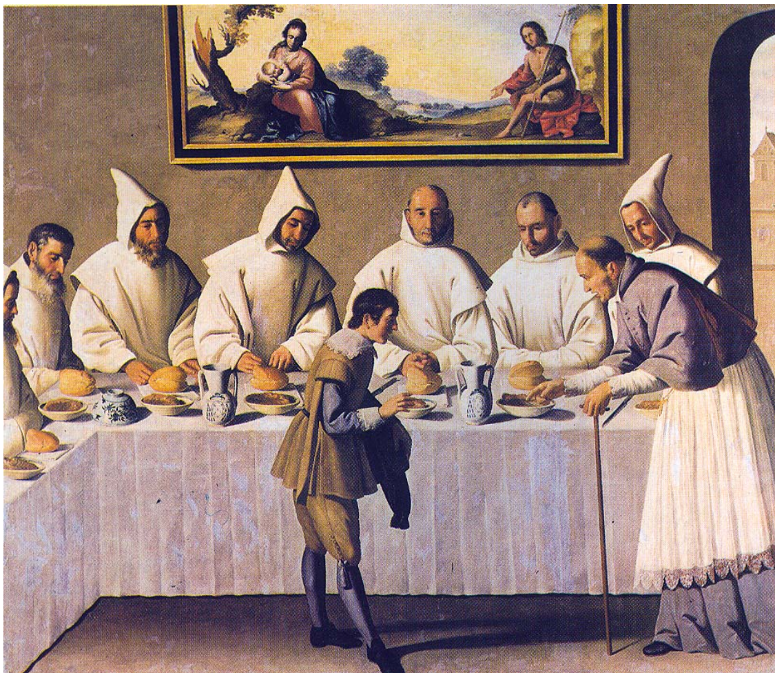
Opat Hugo z Cluny v refektáři kartuziánů (kolem roku 1630)

Po Valdštejnově tragické smrti v Chebu v roce 1634 se obrátil převor kláštera P. Filip Buschek na císaře Ferdinanda II. se žádostí a prosbou o potvrzení majetku darovaného kláštera (tzv. fundace). Současně působil na císaře i nepřímo prostřednictvím jeho vlivného zpovědníka jezuitského řádu Viléma Lamormaina, v němž našel mocného přímluvce. Císař odpověděl vydáním majestátu ze dne 20.3.1635, jímž nejen potvrdil původní Valdštejnovu fundaci z roku 1627 v plném rozsahu a ponechal klášteru veškeré jeho dosavadní jmění, ale navíc ještě rozšířil odkazem některých nemovitostí a pozdějších pohledávek, které měl Valdštejn u svých manů (tj. vazalů). Tak se dostal do vlastnictví valdických kartuziánů také dům zemského hejtmana v Jičíně, který se však stal předmětem sporu s novým držitelem jičínského statku Rudolfem hrabětem z Tieffenbachu. Pohledávky u 11 manů činily sumu 50.650 zlatých 24 krejcarů, avšak u většiny dlužníků byly nedobytné i přes urgence cestou České komory (tj. ústředního finančního orgánu). 82