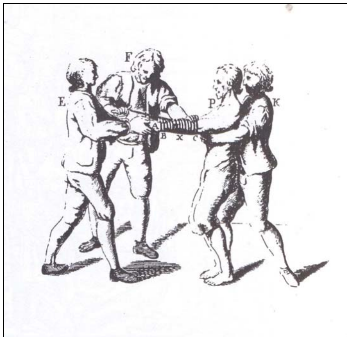
Bolestivé svazování rukou k vynucení přiznání (18. století)