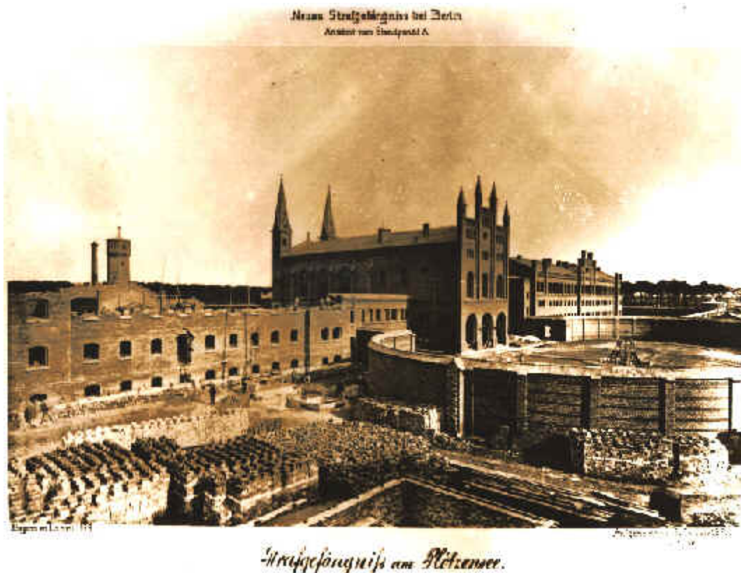
Historická pohlednice věznice Plötzensee

v nové budově v samovazbě, /:165 cel:/ která pojímá živly nezkažené i nejhorší. Čítá 550 vězňů, rozdělených na tři disciplinární třídy. Ústav má odbočku ve staré pevnosti Hohenaspergu 55 , kde jsou oddělení pro tuberkulosní, syfilitiky, mrzáky a duševně choré. Krásná poloha ústavu s dalekým rozhledem a dostatkem svěžího vzduch uzpůsobuje ho vynikající měrou k jeho účelu. Budovy jsou většinou staré, nové křídlo samovazby se teprve buduje. Pojímá vězňů odsouzených ku káznici nebo vězení kolem 200. Celkem oba ústavy zaměstnávají 130 dozorců.