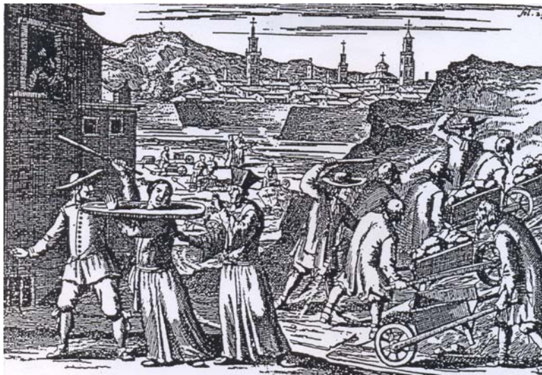
Použití tzv. housliček při vyvádění vězňů (17. století)