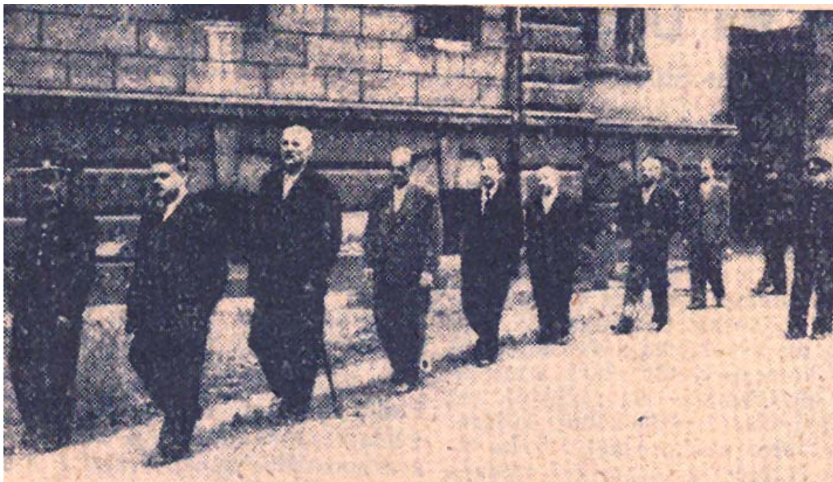
Vycházka členů protektorátních vlád v pankrácké věznici.

Práci lékařů ztěžoval všeobecný nedostatek léků a zdravotnického materiálu. Lůžková kapacita vězeňské nemocnice byla stále přeplněna a z tohoto důvodu zůstávali nemocní často ležet na přeplněných celách samovazby. O předvádění vyšetřovanců k lékaři a zdravotních úlevách (ležení na cele, zkrácené vycházky) rozhodoval příslušný dozorce ve službě. Lze důvodně předpokládat, že zdravotní stav členů protektorátních vlád byl některými dozorci spíše podceňován vzhledem k osobní averzi. 17