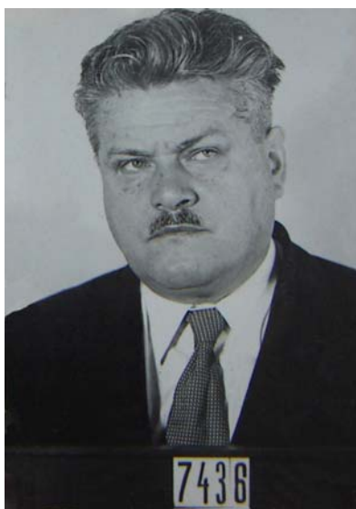
Ve vyšetřovací vazbě