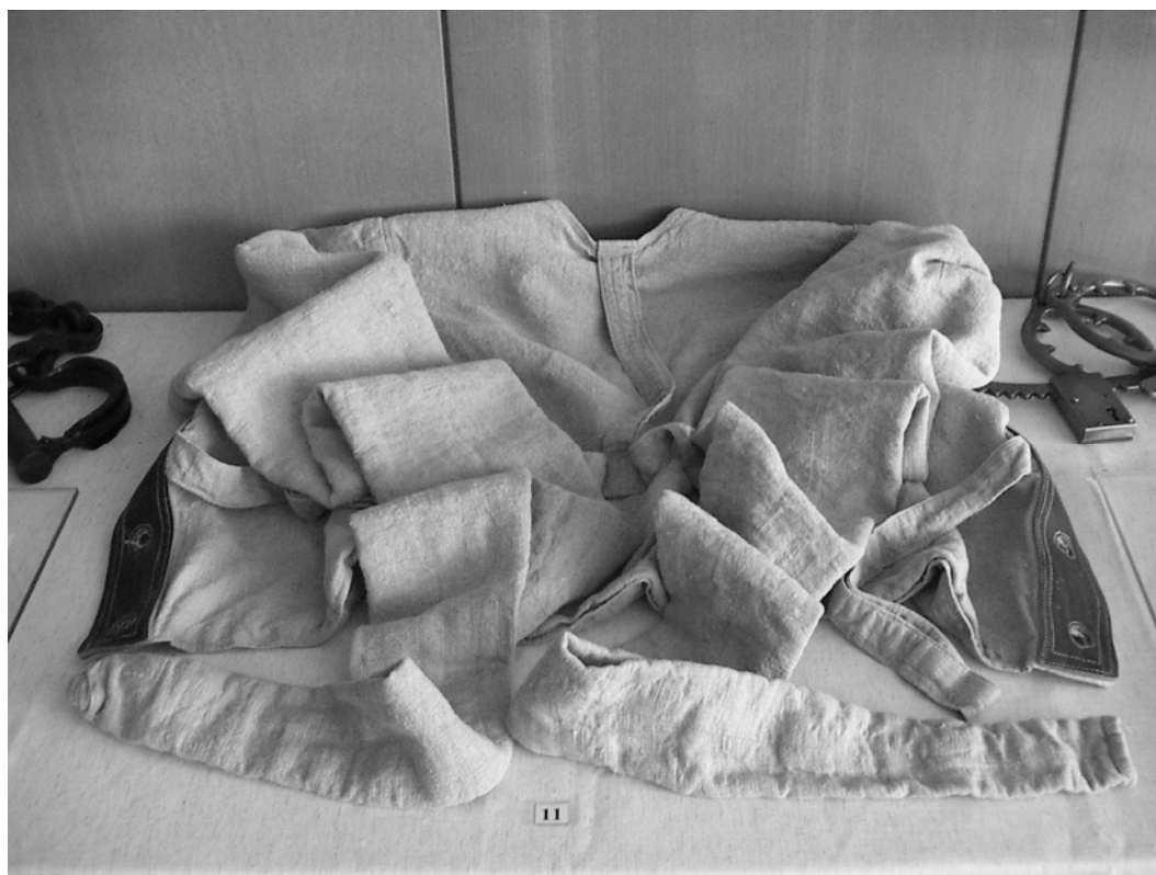
Svěrací kazajka ke zklidnění agresivního vězně (19. století)