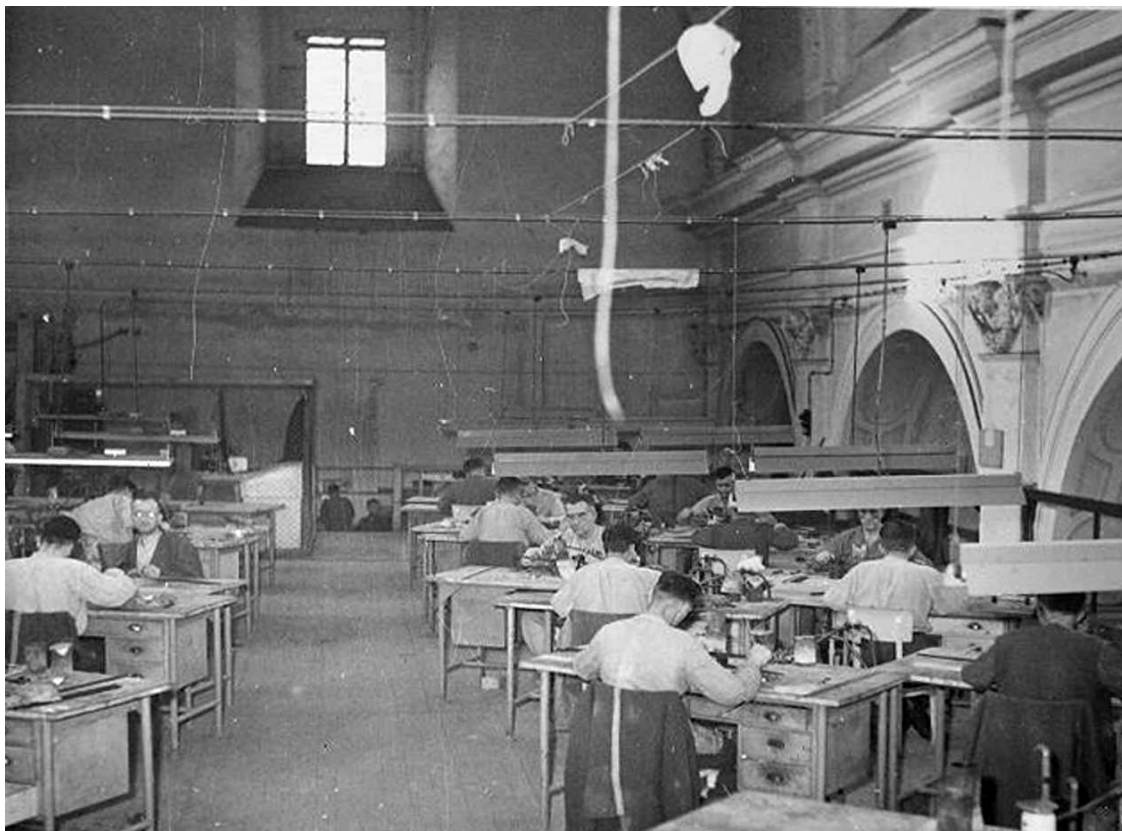
Pracoviště bižuterie ve zrušeném ústavním kostele