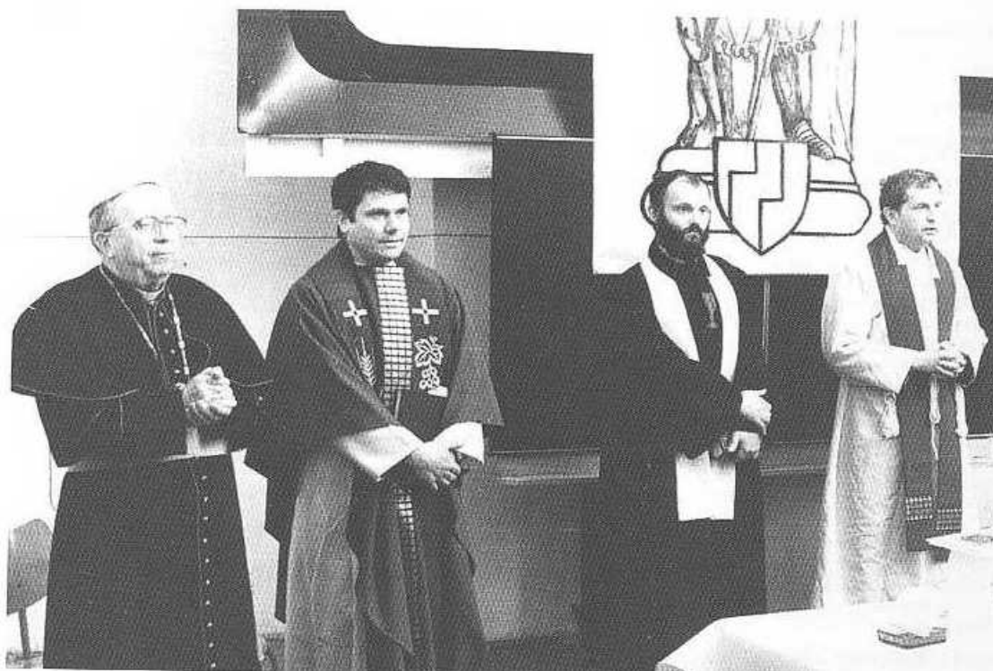
Ekumenická bohoslužba ve Věznici Valdice za účasti biskupa Karla Otčenáška v roce 1990 (první zleva)