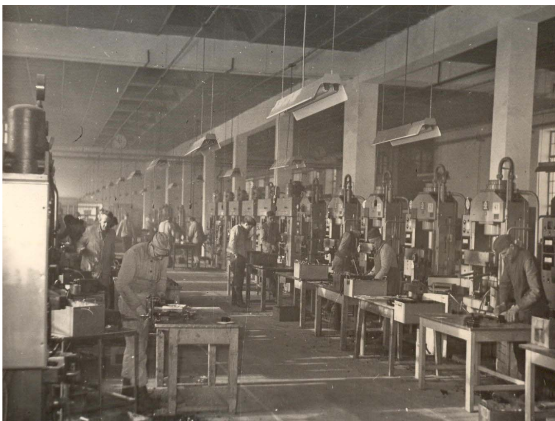
Výrobní hala nové lisovny umělých hmot v NVÚ Valdice