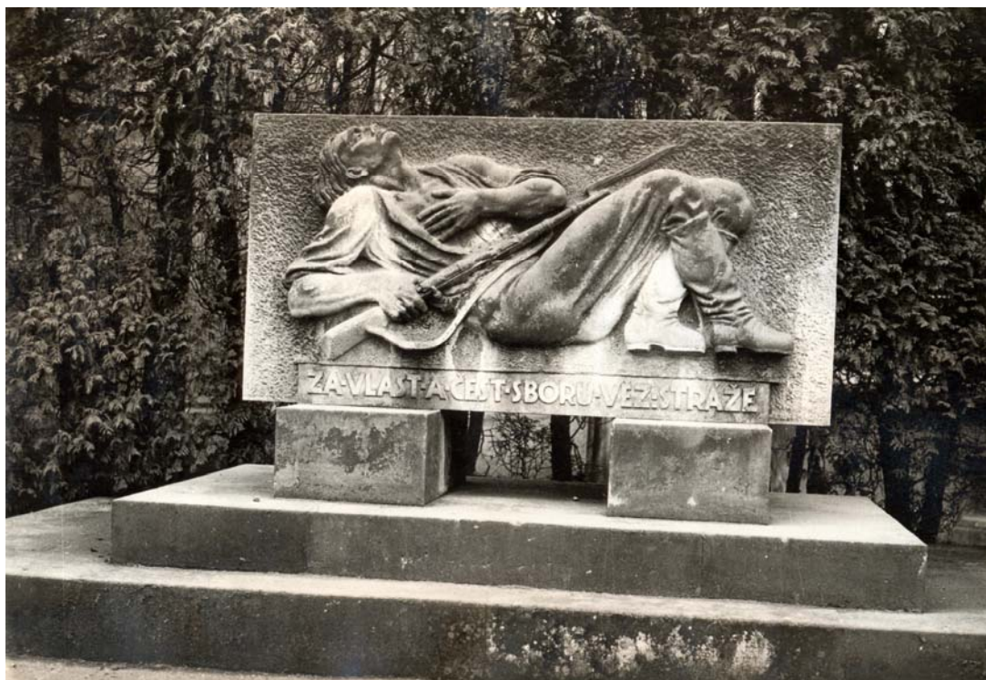
Pomník obětem protinacistického odboje z řad příslušníků SVS ve Valdicích (odhalen 28.9.1946)

příslušníci vězeňské strážní a správní služby. Velitele oddílů SVS přímo řídil velitel SVS, jmenovaný ministrem spravedlnosti. Dohled nad výkonem trestu odnětí svobody vykonávali od roku 1949 ústavní komisaři a od roku 1950 též příslušní prokurátoři.