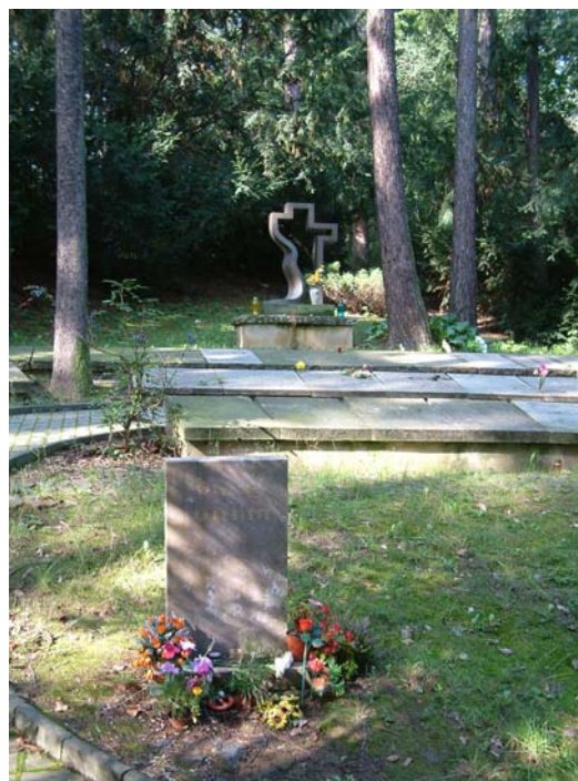
Společné pohřebiště na hřbitově v Praze- Motole