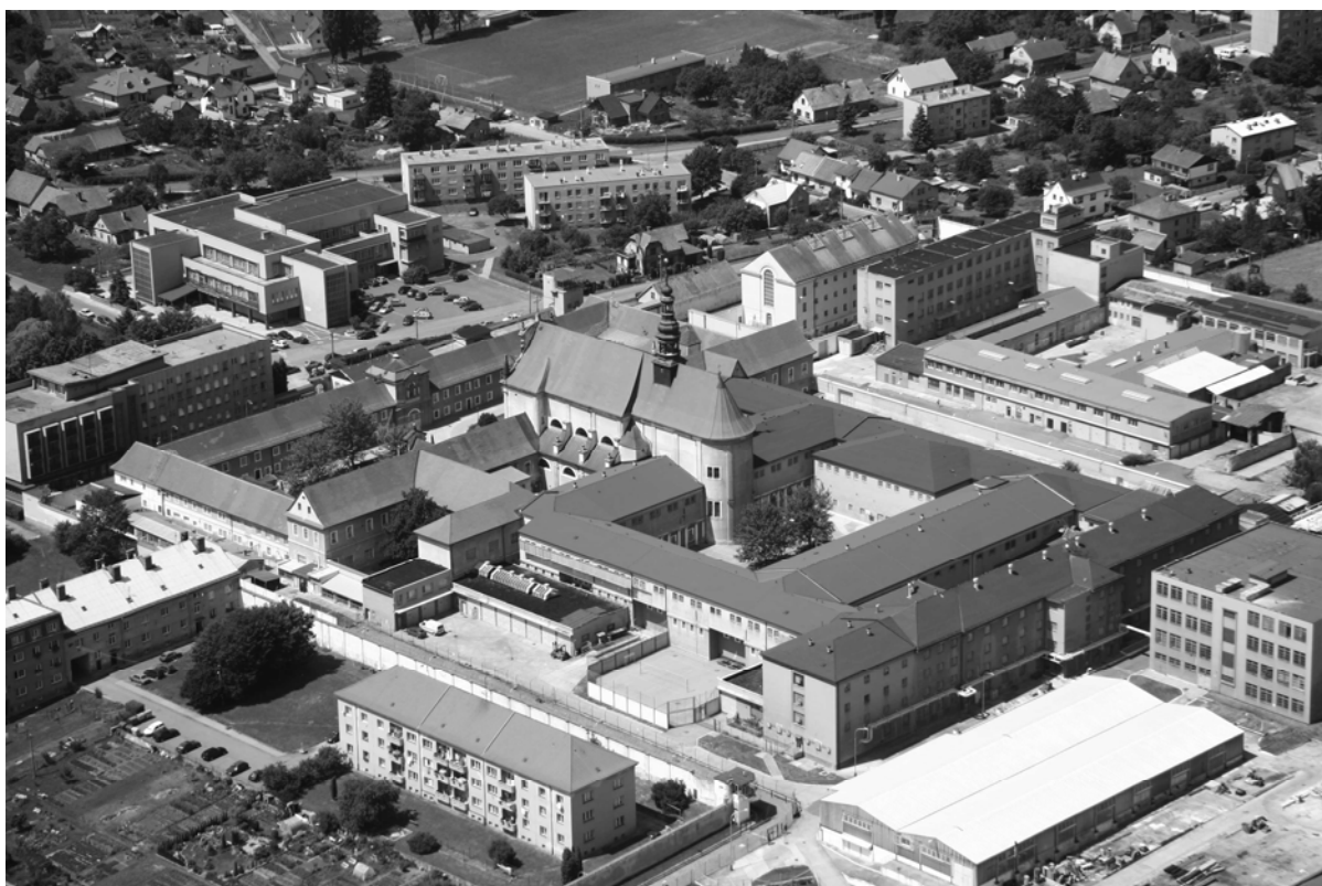
Letecký snímek Věznice Valdice