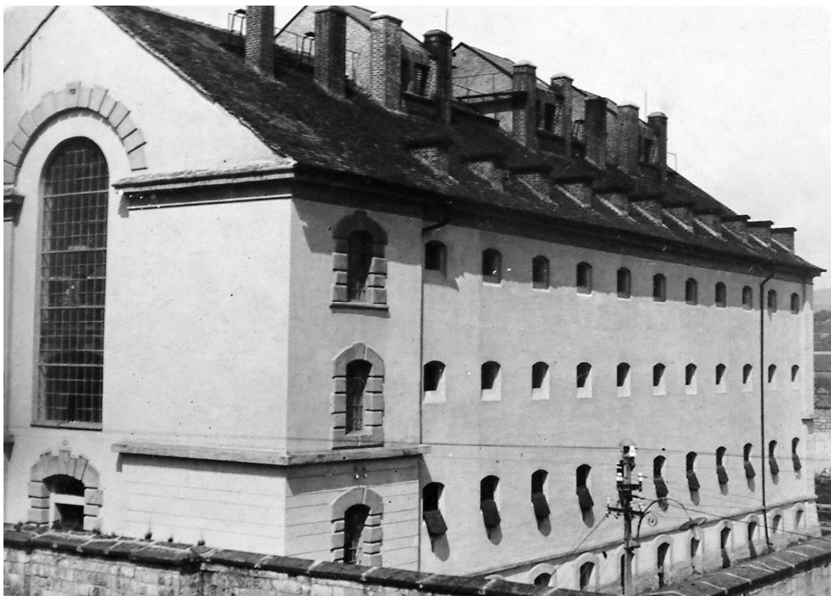
Objekt vyšetřovací věznice gestapa z let 1941-1945