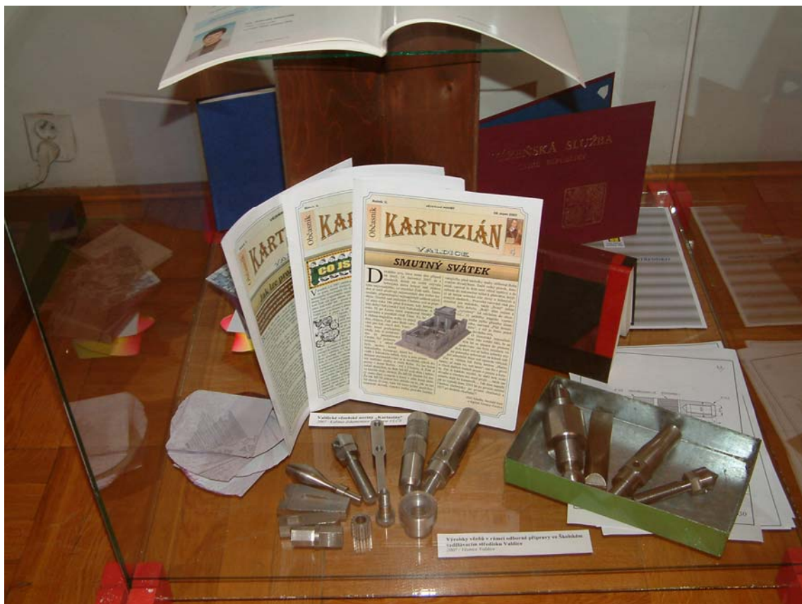
Ze současné činnosti odsouzených ve Věznici Valdice