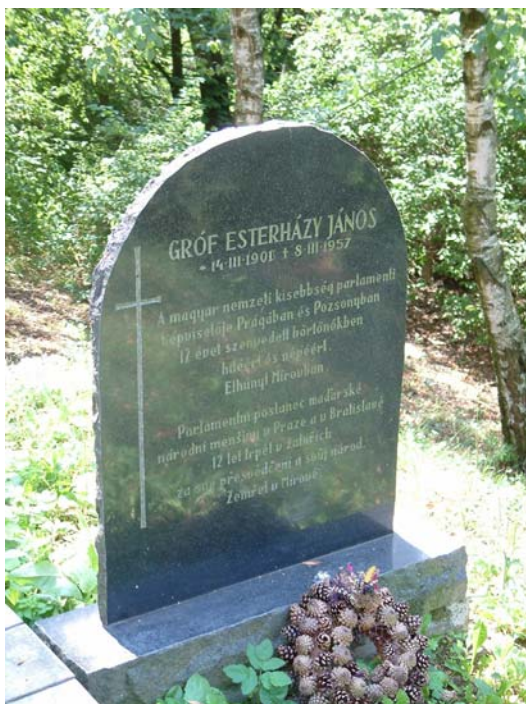
Náhrodek J. Esterházyho na bývalém vězeňském hřbitově Věžnice Mírov