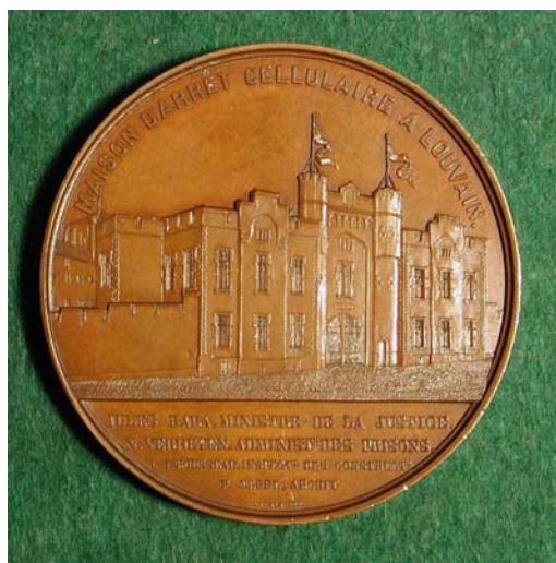
Pamětní mince s vyobrazením věznice v Louvain

Školu navštěvují v Belgii vězňové do 40 let, pokud byli odsouzeni k tretu delšímu šesti měsíců. Pro dospělé vězně konají se též přednášky. Učení jazykům kvete zvláště v trestnici v Luvani, kde nyní čte 145 vězňů anglicky. Tamní učitel sestavil litografovanou učebnici anglického jazyka pro samouky. Stejná učebnice existuje pro kreslení. Školní vyučování děje se odděleně pro Vlány a Valony a dle stupňů /:obyčejně tři:/ pokročilosti. Některé trestnice trpí nedostatkem místností. Tak v Louvani děje se vyučování v oddělené části kaple. Neškole se užívá ještě většinou krytých, izolujících sedadel. Každá věznice má knihovnu o několika tisících svazků. Organizací rozdělení knih a revuí vyniká trestnice luvanská. Konečně třeba se zmíniti o škole hospodyňské v ženském oddělení trestnice v Bruselu – Forest.