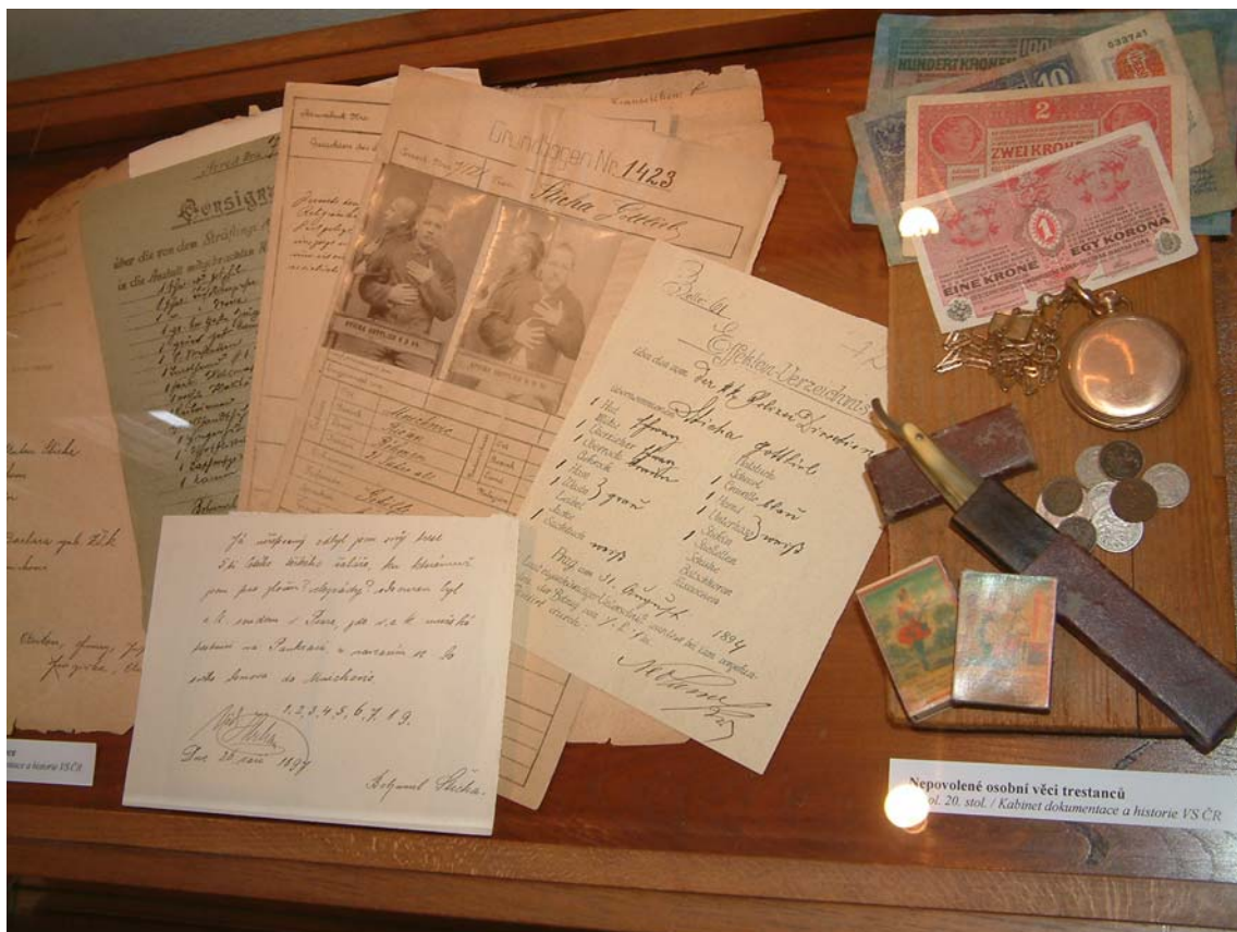
Vězeňské realie z konce 19. století