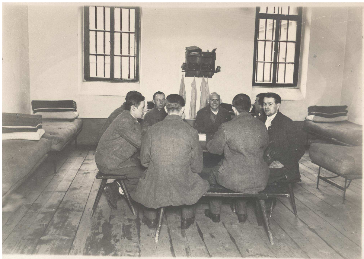
Trestanci ve společné vazbě (Kabinet dokumentace a historie VS ČR)