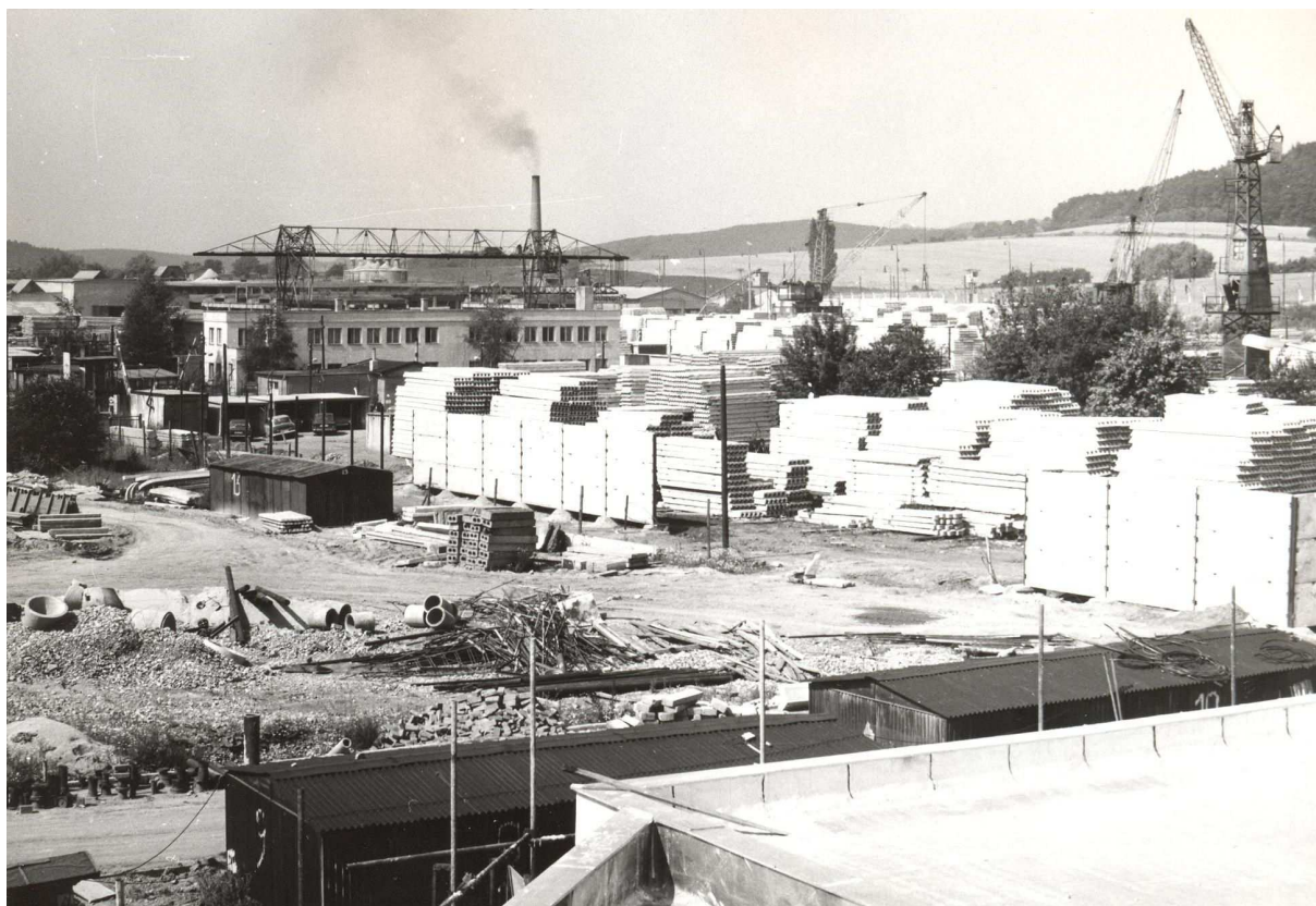
Pracoviště Prefa Brno (Kabinet dokumentace a historie VS ČR)