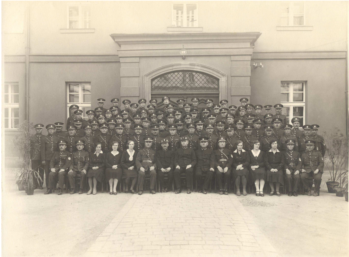
Personál věznice ve 20. letech 20. století (Kabinet dokumentace a historie VS ČR)

a vycházky. Večeře byla vydávána od 15,30 do 16,00 hodin a další čas trávili na celách (ložnicích), kde se mohli zabývat učením, psaním dopisů, četbou a povolenou zábavou. Za hrubé porušování denního pořádku byly ukládány disciplinární tresty, obdobně jako v letech 1889 – 1918 s výjimkou trestu úplného nebo částečného propadnutí úspor a trestu odepření ranní polévky. 126