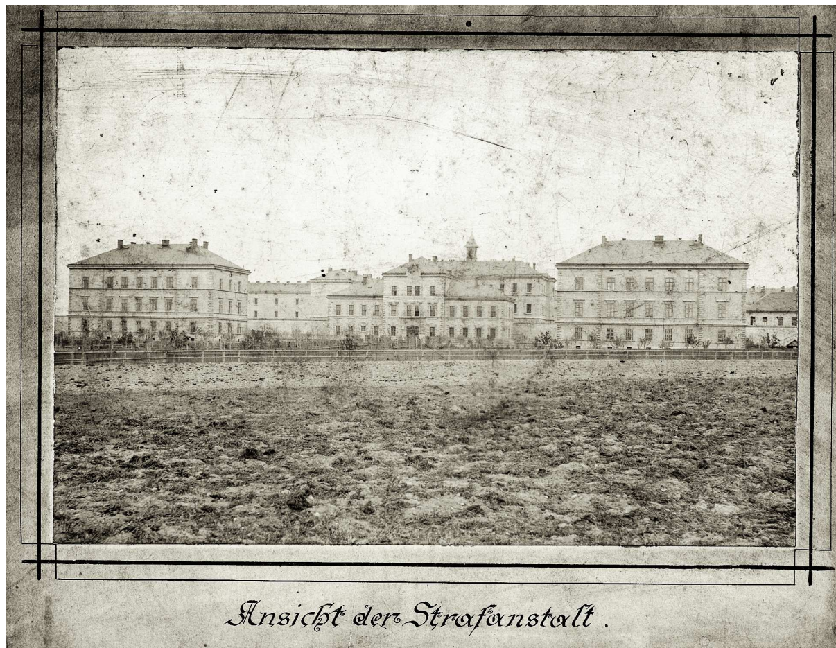
C. k. mužská zemská trestnice Praha – Pankrác (Kabinet dokumentace a historie VS ČR)

pohřbívána těla sebevrahů. Pohřeb byl zakončen zvoněním hřbitovního zvonu. Do vězeňského oddělení na Zelené lišce se vcházelo od silnice na západní straně a stopy po tomto vchodu jsou dodnes patrné. Pohřby se konaly bez přítomnosti příbuzných a známých, neboť těla zemřelých nebyla v té době rodině vydávána. 100