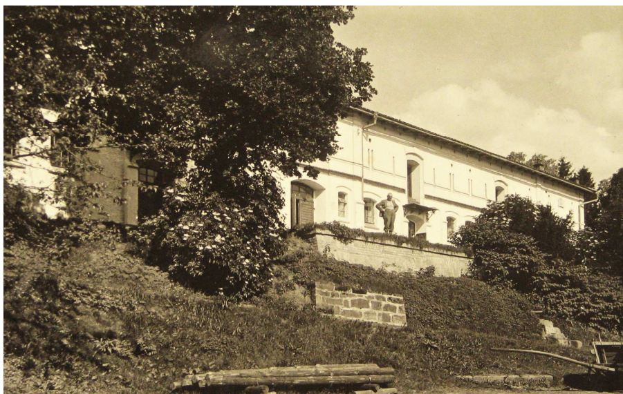
Statek Javorník v roce 1936 (SOkA Trutnov, f. Archiv obce Javorník, inv. č. 1, kn. č. 1.).

Z regionálního hlediska tak většinou vznikly dva justiční statky pro jednu oblast – Slatinice a Mlékojedy v severních Čechách, Nedražice a Zálezly v západních Čechách, Zámorsk a Javorník ve východních Čechách, Mikulov a Chvalovice na jižní Moravě. Po jednom statku bylo ve středních Čechách (Řepy) a na severní Moravě (Šenov). Výjimku představovaly jinak agrárně výrazně orientované jižní Čechy, avšak lze předpokládat souvislost s absencí většího trestního ústavu na jejich území. Zajímavým jevem je existence více hospodářství v těsné blízkosti. Tak tomu bylo na západě Čech, kde vzdálenost mezi nimi činila pouze 3,5 kilometru. Vysvětlení je možné najít v citovaném výnosu ministerstva spravedlnosti, kde se pro plzeňskou trestnici počítalo s velkým statkem v pohraničí. Je pravděpodobné, že k dispozici nebyla vhodná usedlost, takže dvě menší v bezprostředním sousedství představovaly náhradní řešení. Na Slovensku pak existoval jediný statek v Leopoldově.