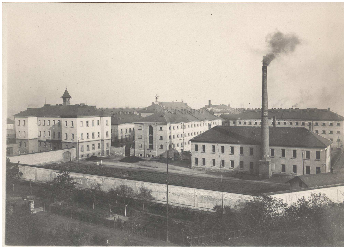
Pankrácká věznice ve 20. letech 20. století

V roce 1918 přešla pankrácká c.k. mužská trestnice do majetku československého státu a sloužila původnímu účelu do roku 1926, kdy se stala soudní (vazební) věznicí Zemského soudu trestního v Praze na Karlově náměstí. V roce 1929 pokračovala ve své činnosti jako soudní věznice Krajského soudu trestního v Praze, jehož sídlem se stal v roce 1933 nový justiční palác, postavený v bezprostřední blízkosti. Po překonání hospodářských potíží státu bylo započato s modernizací věznice. V roce 1920 byla zrušena vlastní plynárna, vyrábějící plyn především k osvětlení areálu věznice i jednotlivých budov. Současně byla věznice připojena na městský rozvod plynu a elektřiny a došlo k elektrifikaci všech osvětlovacích těles ve vnějších prostorech i uvnitř budov. V průběhu roku 1922 byly upraveny cely pro oddělení mladistvých vězňů a vzniklo oddělení vězeňské nemocnice pro těhotné ženy a matky po porodu, které bylo využíváno pro trestanky z celé republiky. V průběhu roku 1926 bylo upraveno křídlo „A“ společných vazeb pro trestanky, 24 cel v křídlech „C“ a „A“ samovazeb přestavěno na společnou vazbu a suterén kancelářské budovy využit ke zřízení přijímacích cel. Stavební úpravy věznice byly dokončovány v letech 1928 – 1930. Ubytovací kapacita se zvýšila z 811 na 1169 míst, vzniklo 13 dílen, pokračování škola a vstupní (čelní) budova byla