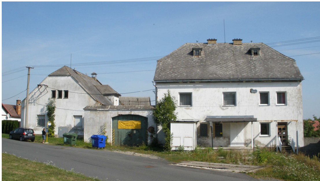
Justiční statek Mírov – současný stav

Předkládaná studie je prvním výstupem z dlouhodobé mezirezortní odborné spolupráce Kabinetu dokumentace a historie Vězeňské služby ČR a Národního zemědělského muzea v Praze, jejímž cílem by mělo být monografické zpracování tématu „Justiční statky“. Na základě dosažených výsledků bude zvažováno rovněž uspořádání výstavy k této problematice.