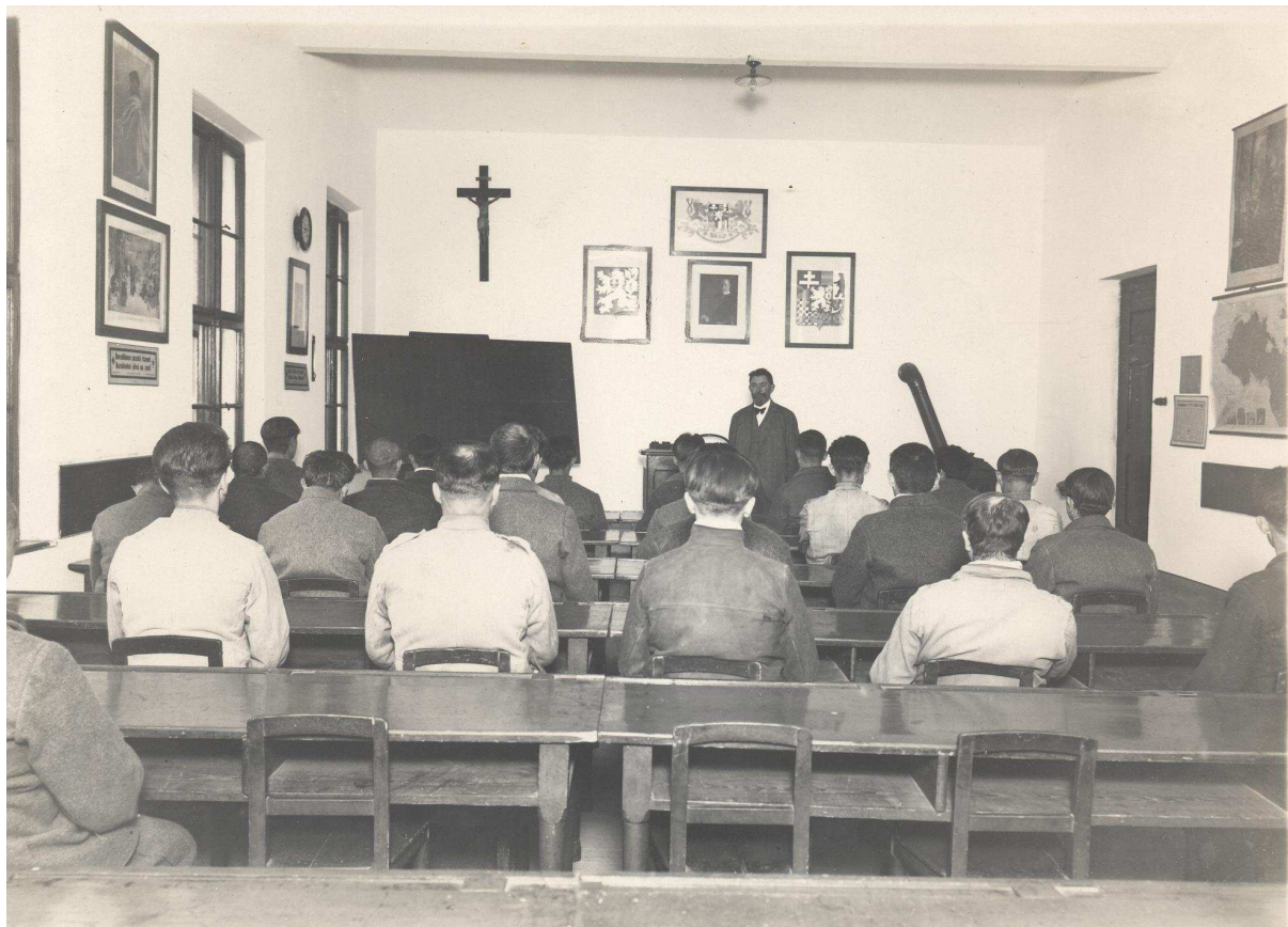
Ústavní škola (Kabinet dokumentace a historie VS ČR)

K uplatňování a ochraně svých práv mohli trestanci předkládat své „prosby a stížnosti vězeňskému úředníkovi, řediteli věznice nebo radovi krajského soudu, pověřenému dohledem nad věznicí. Za bezdůvodnou, svévolnou stížnost nebo křivé nařčení vězeňské stráže, úřední či jiné osoby hrozil disciplinární trest. 123