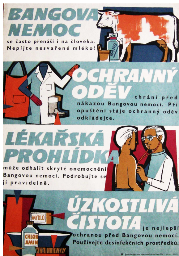
Plakát Ústředního ústavu zdravotnické osvěty z roku 1960 (Archiv Národního zemědělského muzea Praha, Sbíрка plakátů, inv. č. 483).

Zajímavé je, že při každém dojení musel být ve stáji příslušník SVS, který dozíral na správný postup, kontroloval, zda byly všechny dojnice řádně vydojeny, zda bylo měřeno mléko a celém průběhu vedl přesný záznam. V každém kravíně pak vyvěsil tabuli o přehledu dojivosti krav s příslušnými rubrikami, kolik bylo nadojeno ráno, v poledne, večer a celkem denně, s rubrikou, kolik bylo nadojeno v týdnu. Tato tabule sloužila jednak k evidenci dojení a jednak měla ten význam, aby odsouzení, kteří byli pověřeni tímto úkolem, „sledovali vzestup eventuelně sestup dojivosti a snažili se výsledek stále zlepšovati.“ 57