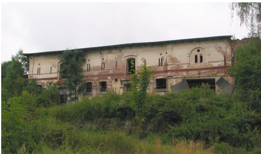
Statek v Javorníku – současný stav.

Samozřejmě, že do hospodářských usedlostí nepřišli první odsouzení ihned po předání ministerstvu spravedlnosti. Nejprve bylo nutné provést mnohé stavební úpravy, aby následně vyhovovaly nárokům kladeným na zařízení určená k výkonu trestu. Tyto adaptace, uskutečňované těsně po skončení války, bezpochyby představovaly velkou zátěž. Pomoc přišla, stejně jako v jiných směrech poválečné regenerace Československa, z akce UNRRA. Vězeňská správa tak mohla jako jediná z rezortu justice využívat těchto prostředků, a to výhradně na zemědělskou obnovu nebo zvýšení živočišné výroby. Již v roce 1946 došlo k přidělení prvního poměrně velkého obnosu činícího tři miliony korun. O rok později byla navýšena o další milion. Počátkem roku 1949 se zemědělská výroba z popudu vlády soustředila na výkrm prasat, což přinášelo další zvýšení nákladů. Proto ministerstvo financí uvolnilo ještě 2 673 000 korun. Celkem tedy velitelství SVS do samostatných hospodářství investovalo 6 673 000 korun. Nešlo však jen o stavební záležitosti, podmínky úvěrů umožňovaly také nákup hospodářských strojů, živých zvířat, krmiv, hnojiv a dalších zemědělských potřeb. 18