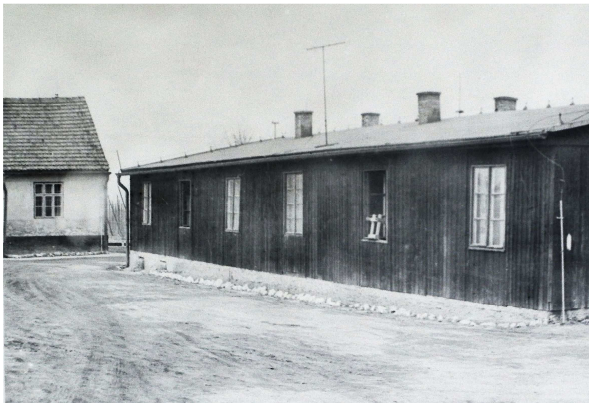
Původní objekty NPT Ostrava Heřmanice

Třicet let činnosti jako samostatné vězeňské zařízení oslaví v roce 2009 věznice Kuřim. Rozkazem ministra spravedlnosti ČSR byl dnem 1. července 1979 zřízen Nápravně výchovný ústav v Kuřimi v rámci Sboru nápravné výchovy ČSR. 114 Tím došlo k odloučení dosavadní pobočky, umístěné přímo v areálu panelárny závodu n.p. Prefa Brno (v provozu v letech 1956-1979) od tehdejšího Nápravně výchovného ústavu Brno, kde odsouzení muži pracovali při výrobě stavebních dílců a betonových prefabrikátů pro bytovou a průmyslovou výstavbu Jihomoravského kraje. Výstavba nového útvaru byla zahájena v roce 1977 podle schváleného projektu n.p. Stavoprojekt Brno a stavbou pověřeny pozemní stavby Gottwaldov, závod Hodonín. Plánovaný rozpočet činil 60 mil. korun. Dne 30. ledna 1981 byly nové objekty slavnostně předány do provozu. Třípatrové budovy pro ubytování odsouzených postavené podélně proti sobě vytvořily uzavřený celek s prostornou nástupní plochou. V přízemní budově za ubytovnami bylo umístěno zdravotní středisko a oddělení pro výkon kázeňských trestů. Přední trakt ústavu tvořila kuchyně s velkou jídelnou, která sloužila současně jako kinosál. V roce 1980 byla dobudována vnější signálně zabezpečovací technika H-3. Za ostrahovým pásmem se nacházela velitelská budova, dále pak garáže, autodílny a kotelna. V těsné blízkosti celého areálu byla postavena ubytovna pro příslušníky. Toto prostorové řešení věznice zůstalo prakticky zachováno do současnosti.