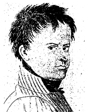
Dobová vyobrazení J. J. Grasela

Text zatykače na J. J. Grasela z 9. listopadu 1815