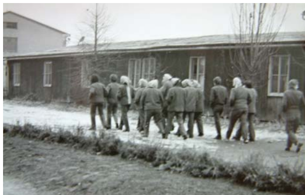
Odsouzené ženy v NPT Pardubice (50.-60. léta)