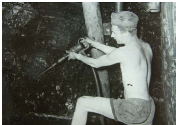
Důlní práce odsouzeného z Nápravně pracovního tábora (NPT) Vlnařice (50. – 60. léta)