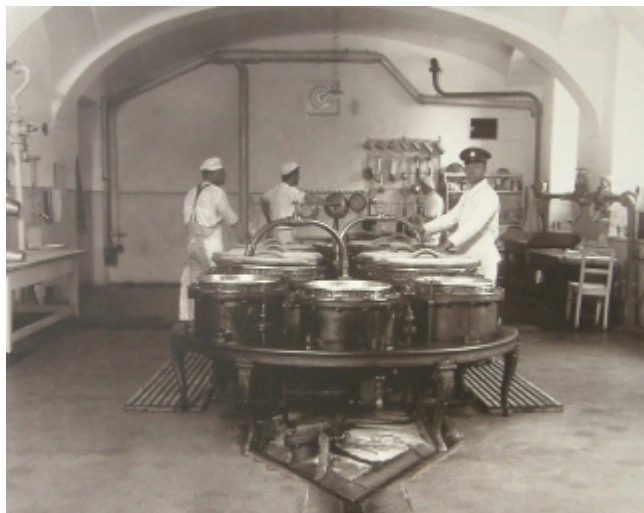
Ústavní kuchyně věznice Plzeň – Bory

Z výčtu surovin pro přípravu stravy pro zdravé vězně, zvláště pak pokud šlo o její biologickou hodnotu, je zřejmé, že kolísala především v závislosti na sezónní dostupnosti některých potravin a na délce jejich možné skladovatelnosti. Nejvyšší podíl činily dieteticky vhodné obiloviny a i dostatek druhů zelenin, které byly ve větším rozsahu pěstovány na vlastních pozemcích zvláště větších věznic a využívány pravidelně, při vynaložení velice nízkých nákladů na jejich kultivaci, v kuchyních věznic.