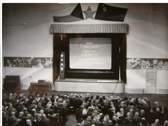
Promítání sovětských filmů odsouzeným v bývalé kapli věznice MV Praha – Pankrác (50. –60. léta)