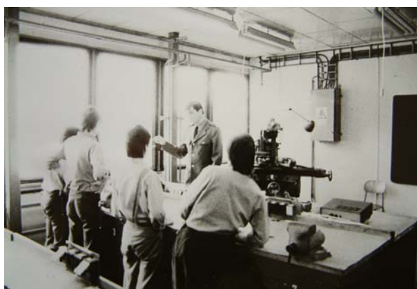
Odborná výuka v Nápravně výchovném ústavu (NVÚ) pro mladistvé Opava (70. - 80. léta)