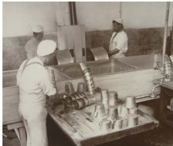
Ústavní pekárna a mechanizovaná linka pro umývání nádobí ve věznicí Plzeň-Bory

Pouze tři z jedenácti receptur ve věznicích vyvařovaných polévek neobsahovaly alespoň pětigramový přídavek zeleniny. K přípravě pokrmů byly využívány především dobře skladovatelné druhy zelenin spolehlivé svým výnosem jako zelí, kapusta, mrkev, cibule, česnek, fazole, kopr, ale i okurky, rajčata a díky možnosti vynaložit dostatek ruční práce i kedlubny. Ve směsi se v pokrmech užívala mrkev, dýně, tuřín, vodnice, špenát a dokonce i žlutá řepa, červená řepa, hlávkový salát, který byl podáván jako „celojídlo“ v množství 400g se solí a octem. Pokud sloužil za přílohu k hlavnímu jídlu, bylo jej jen poloviční množství. Zeleniny se upravovaly většinou v dušeném stavu zahuštěné jíškou i v kombinaci jednotlivých zelenin a brambor. Na 1 porci mělo být využito 300g až 600g nečištěné zeleniny.