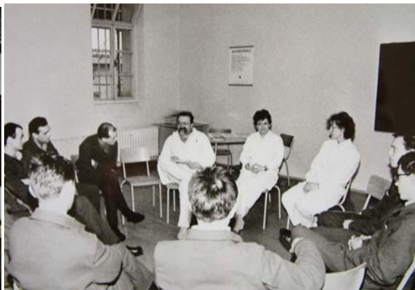
Protialkoholní léčba odsouzených v NVÚ Praha Pankrác(70.-80. léta)