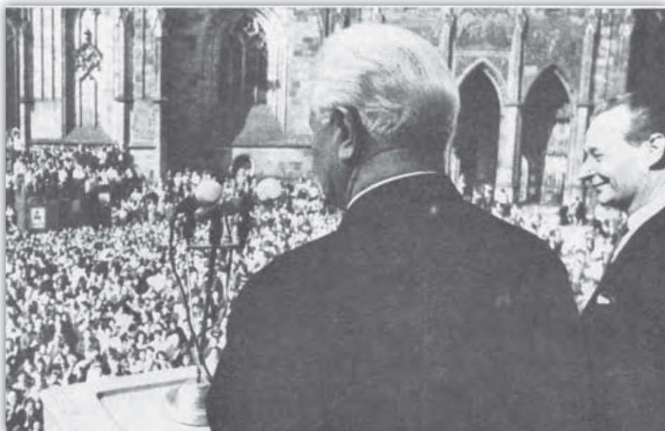
Ludvík Svoboda po zvolení za prezidenta na Pražskom hrade 30. marca 1968 sa víta s občanmi za prítomnosti Alexandra Dubčeka.