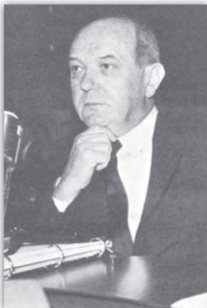
Štátny tajomník (minister zahraničných vecí) USA Dean Rusk