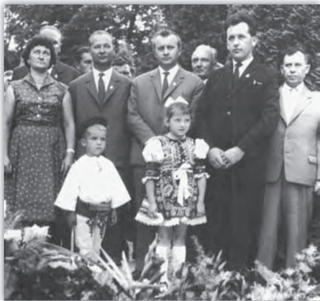
Alexander Dubček a Jozef Lenárt na Národnom cintoríne v Martine.