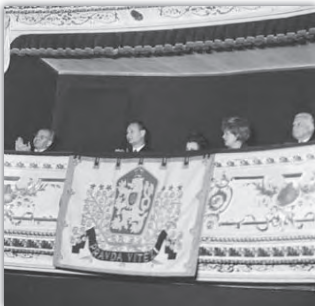
Gustáv Husák, Alexander Dubček s manželkou a Ludvík Svoboda na predstavení v SND 29. októbra 1968