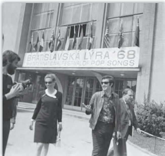
Začala sa Bratislavská lýra.