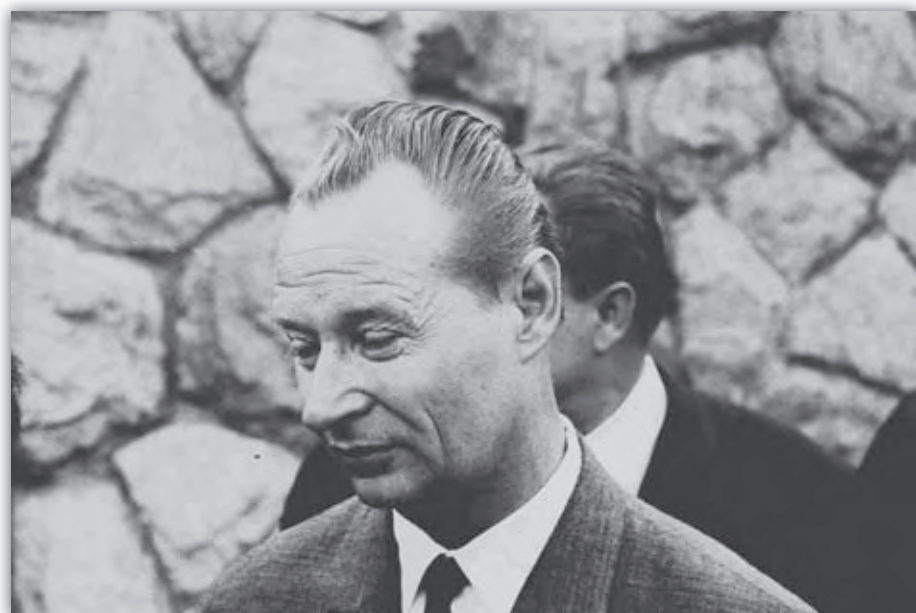
Zamyslenie Alexandra Dubčeka nad bratislavskou schôdzkou predstaviteľov šiestich komunistických strán 3. augusta 1968.