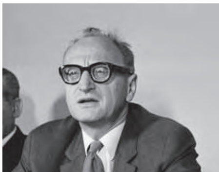
Minister zahraničních věcí ČSSR Jiří Hájek