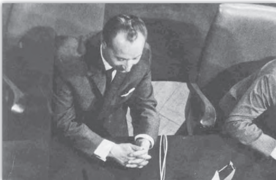
Zopäté ruky Alexandra Dubčeka v Bratislave 3. augusta 1968.