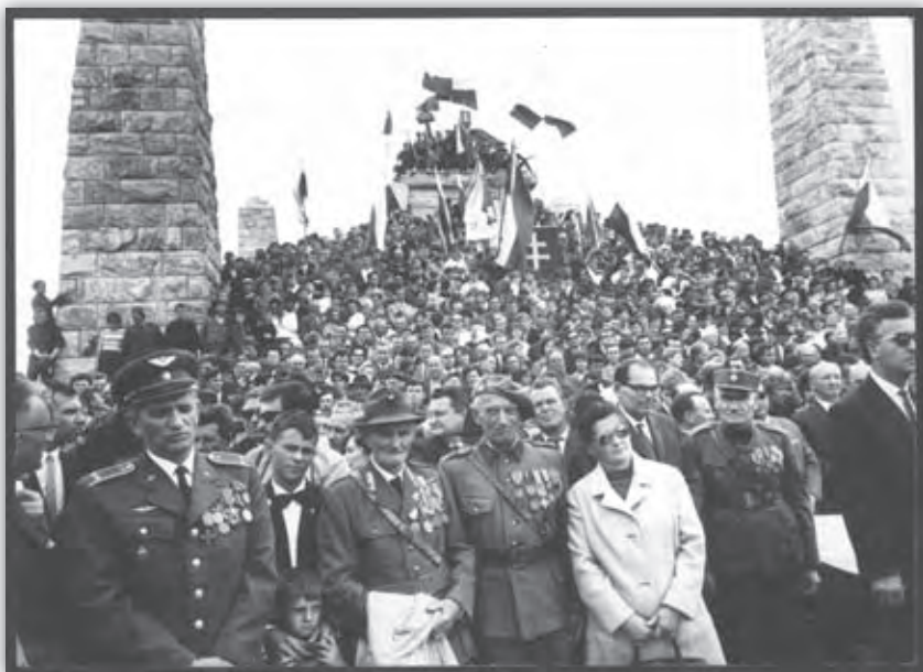
Celkový pohľad na účastníkov stretnutia občanov k 49. výročiu úmrtia Milana R. Štefánika na Bradle 5. mája 1968. V popredí československí legionári, ktorí bojovali v I. svetovej vojne.