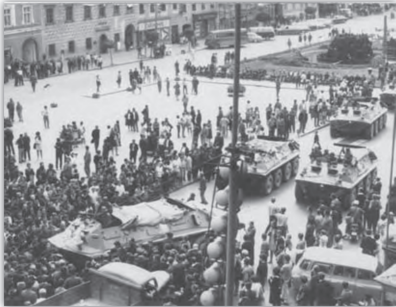
Námestie okupovanej Banskej Bystrice