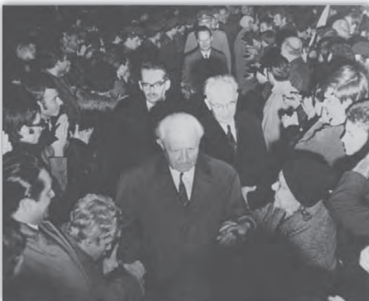
Prezidenta ČSSR Ludvíka Svobodu vítajú občania Bratislavy 29. októbra 1968. Vľavo predseda SNR Ondrej Klokoč, vpravo prvý tajomník ÚV KSS Gustáv Husák a v pozadí prvý tajomník ÚV KSČ Alexander Dubček