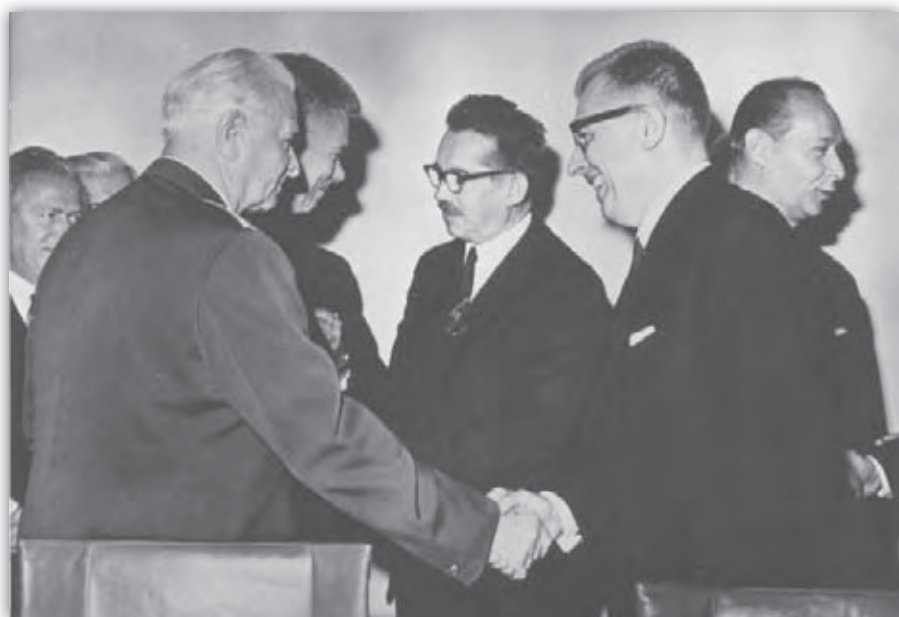
Bratislavský hrad po podpise ústavného zákona o česko-slovenskej federácii 30. októbra 1968. Vľavo v popredí prezident ČSSR Ludvík Svoboda si podáva ruku s predsedom ČNR Čestmírom Císařom, za ním predseda Národného zhromaždenia Josef Smrkovský, v strede predseda SNR Ondrej Klokoč