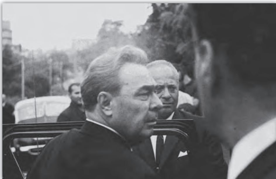
Príchod generálneho tajomníka ÚV KSSZ Leonida I. Brežneva na schôdzku predstaviteľov šiestich komunistických strán do Bratislavy 3. augusta 1968.