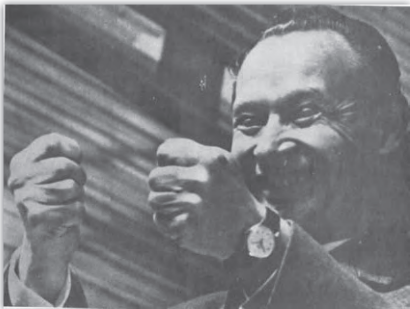
Prvý tajomník ÚV KSČ Alexander Dubček odkazuje: držíme sa!