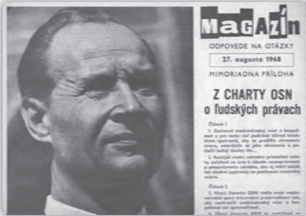
Kam hľadía oči Alexandra Dubčeka? Život, mimoriadna príloha, 27. augusta 1968