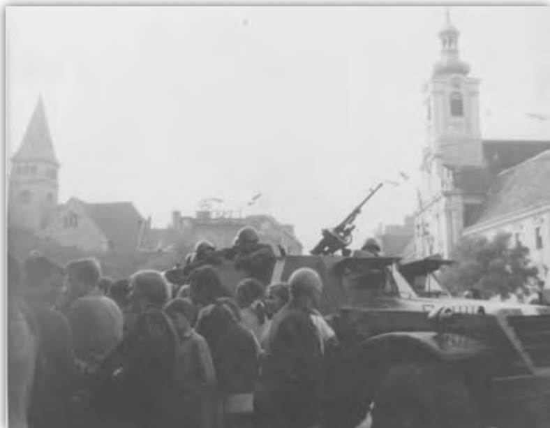
Námestie Slovenského národného povstania v Bratislave