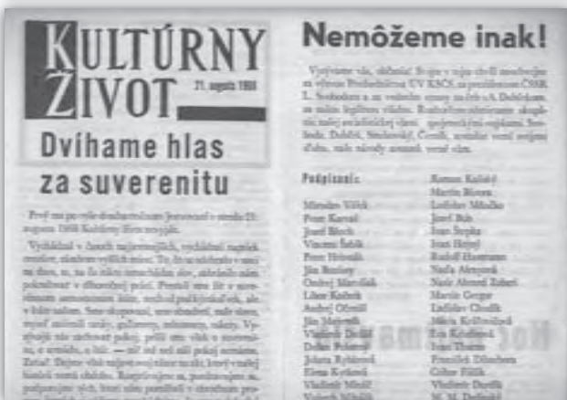
Čítanie © Post Bellum