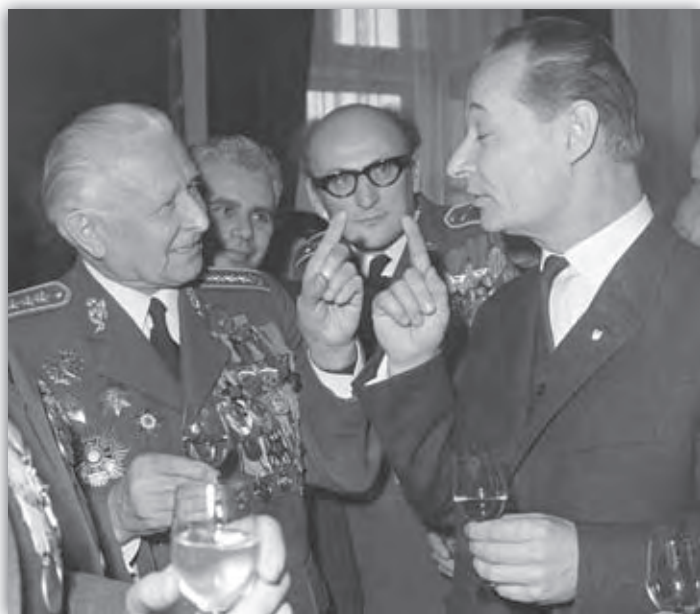
5. marec 1968 – armádny generál Ludvík Svoboda v rozhovore s Alexandrom Dubčekom na Pražskom hrade.