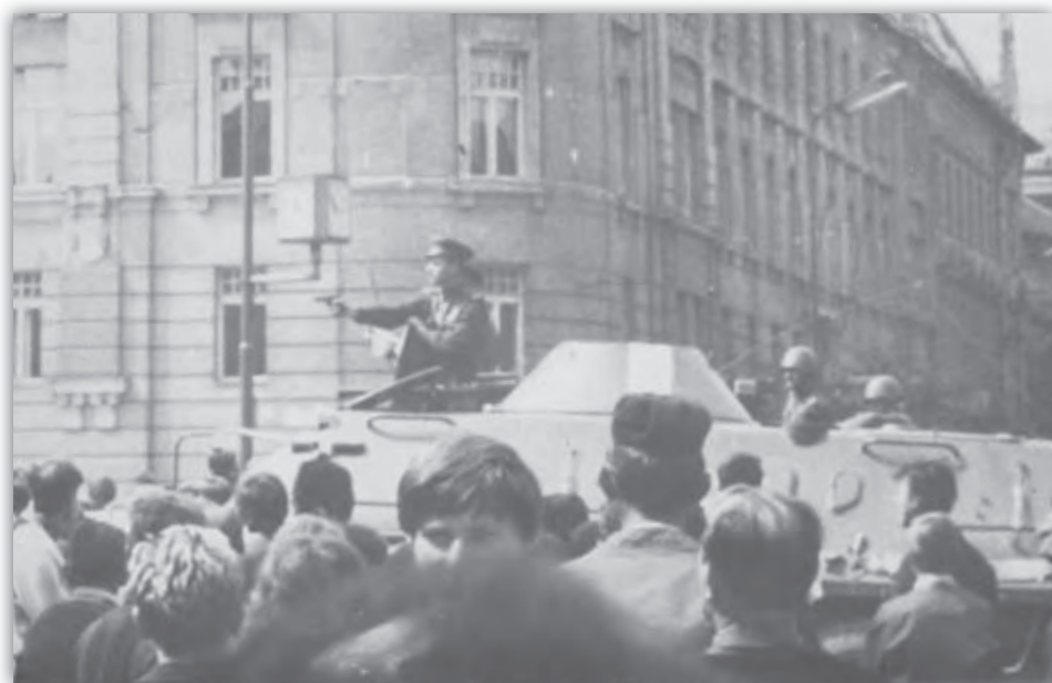
Šafárikovo námestie v Bratislave