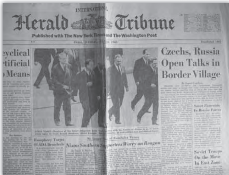
Výber zo svetovej tlače - Herald Tribune