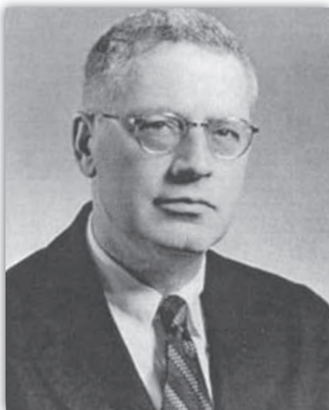
Velvyslanec USA v Praze Jacob Beam