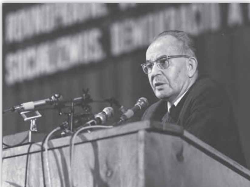
Gustáv Husák na mimoriadnom zjazde KSS v bratislavskom PKO