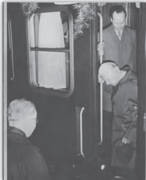
Prvý tajomník ÚV KSS Gustáv Husák stretáva na bratislavskej železničnej stanici prezidenta ČSSR Ludvíka Svobodu a prvého tajomníka ÚV KSČ Alexandra Dubčeka 29. októbra 1968