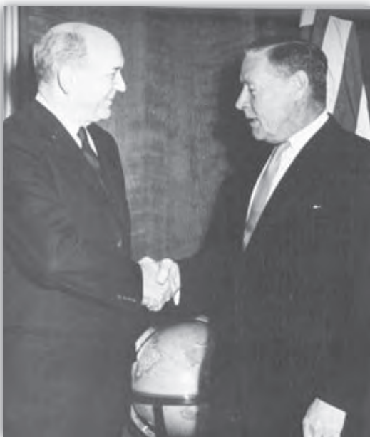
Minister Rusk so svojím poradcom Charlesom Bohlenom