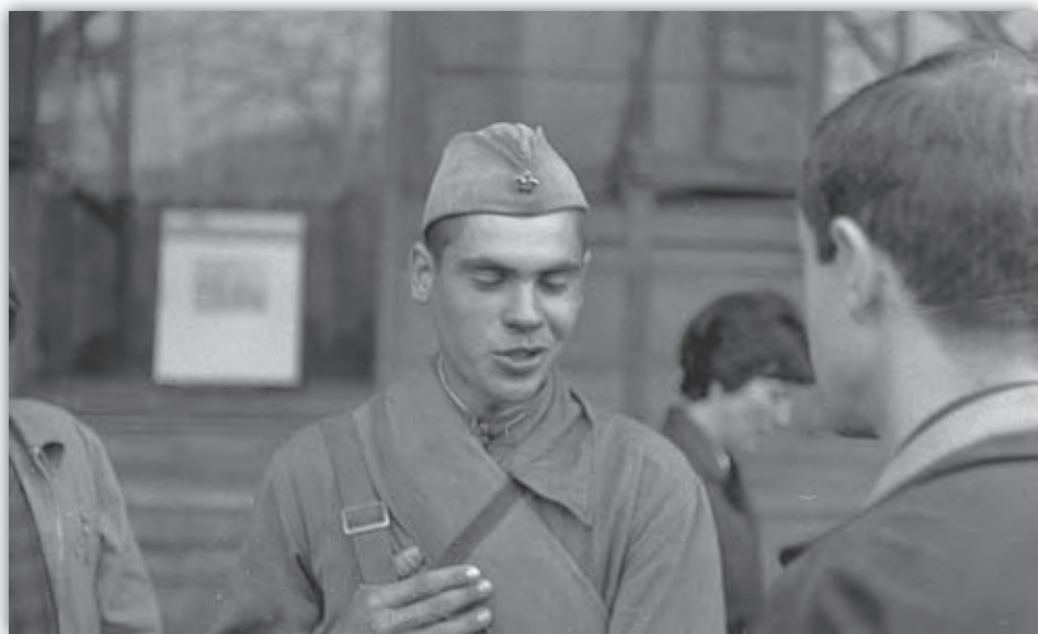
Chápem, o čom mi hovoríš.