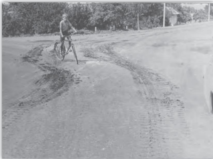
Južné Slovensko. Chlapec medzi pásmi tanku.