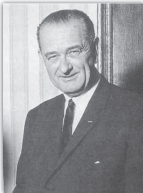
Prezident USA Lyndon B. Johnson