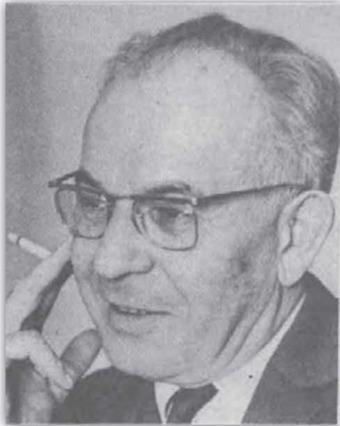
Podpredseda vlády ČSSR Gustáv Husák. Roľnícke noviny, 29. 8. 1968