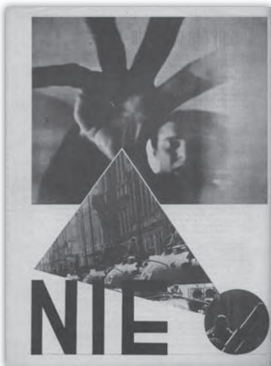
Slovenka, mimoriadne vydanie, 27. augusta 1968