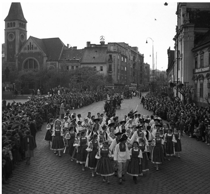
Foto 1 – 9 (s. 230 – 234): Majáles 12. mája 1956 v Bratislave bol prvou spontánnou akciou študentov v uliciach mesta po dlhom čase.