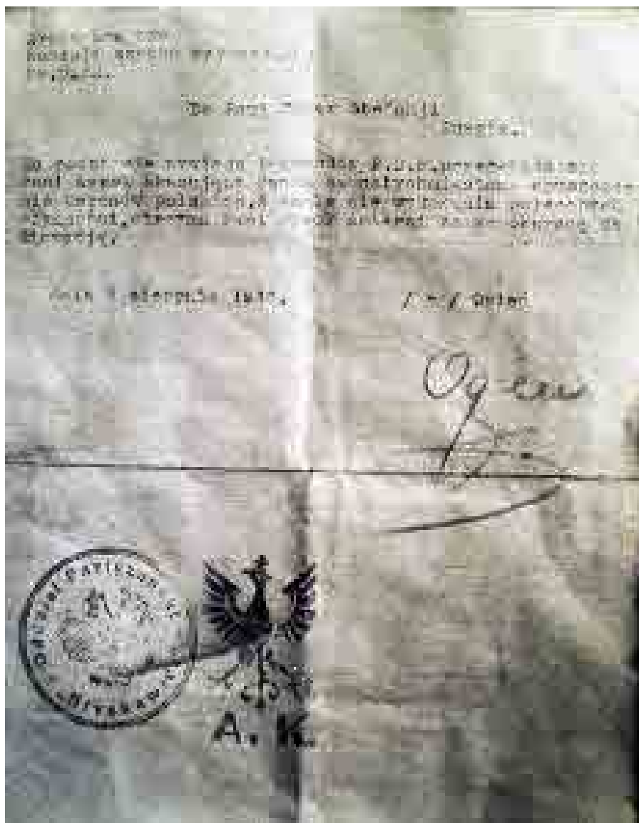
Príloha 2: Nariadenie s vlastnoručným podpisom "Ogna", ktoré slovenskej obyvateľke Jurgova pod hrozbou trestu smrti prikazuje okamžite opustiť poľské územie.

VHA Bratislava, f. VO-4, šk. 2, inv. č. 20, príloha k č. j. 77/Taj. 46