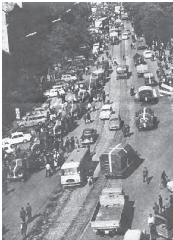
Bratislava po okupácii ČSSR – Štefánikova ulica.