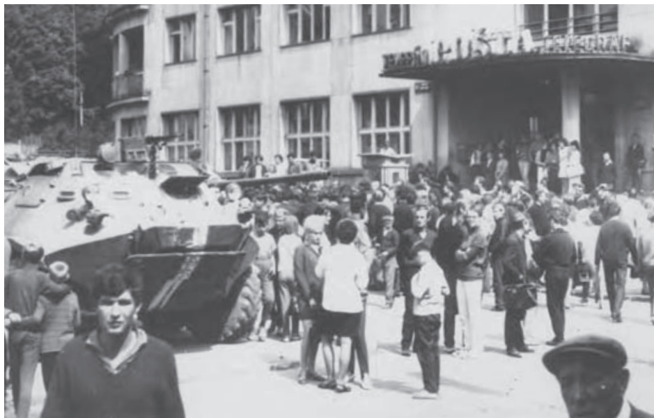
Banská Bystrica. Tanky pred rozhlasovým vysielacom.

Privítanie delegátov mimoriadneho zjazdu KSS 26. – 28. augusta 1968.