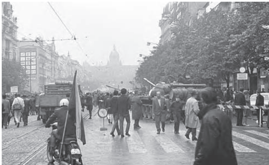
August 1968. Okupačné vojská na Václavskom námestí v Prahe.