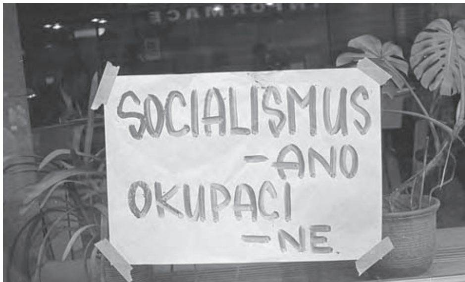
Praha, pouličná protiokupačná ľudová tvorivosť.