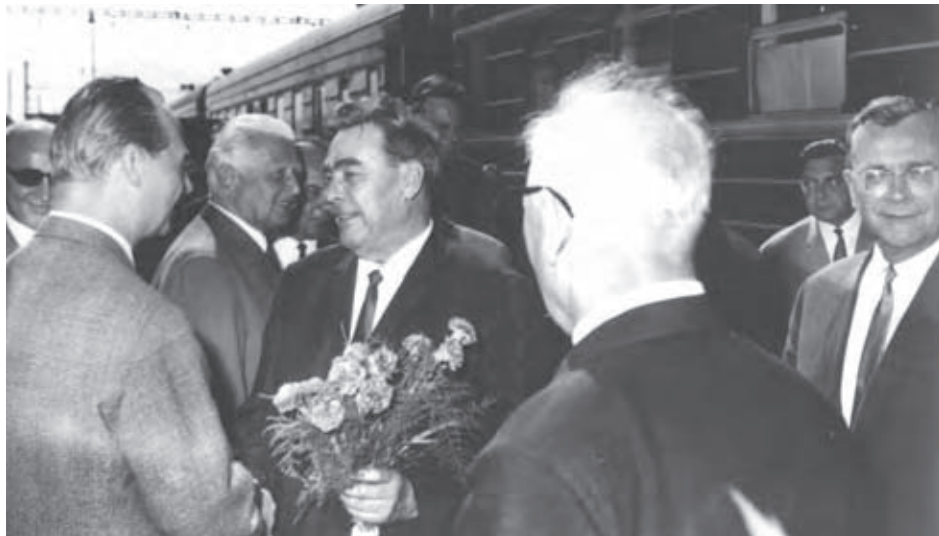
Alexander Dubček, Ludvík Svoboda a Leonid I. Brežnev v Čiernej nad Tisou koncom júla 1968.

Pozývajúci list. Odovzdali ho 3. augusta 1968 v Bratislave.