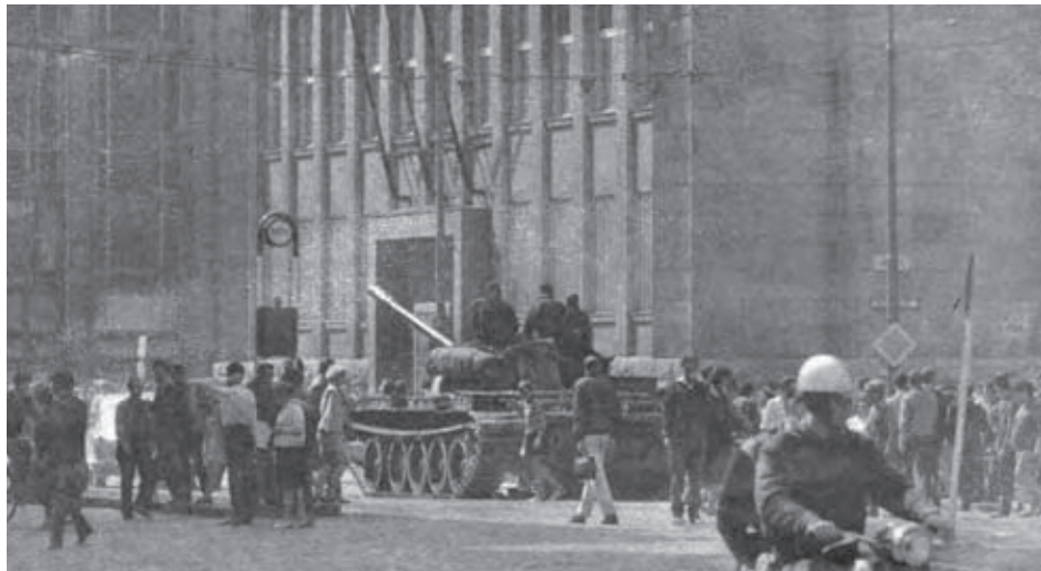
Bratislava po okupácii ČSSR – Štúrova ulica.