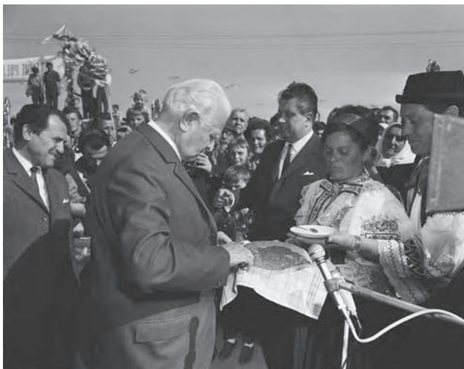
Prezident Svoboda na návšteve Bratislavy 22. apríla 1968.