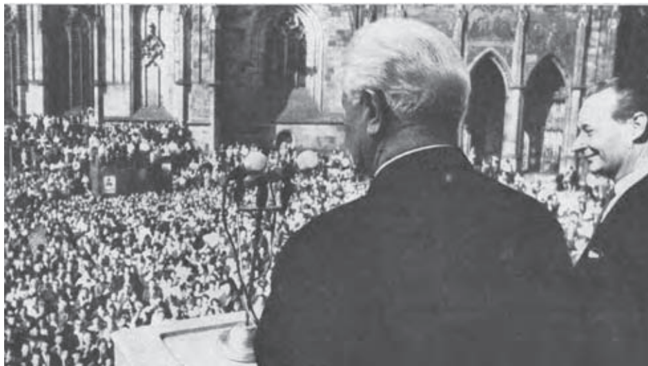
Ludvík Svoboda po zvolení za prezidenta ČSSR 30. marca 1968.