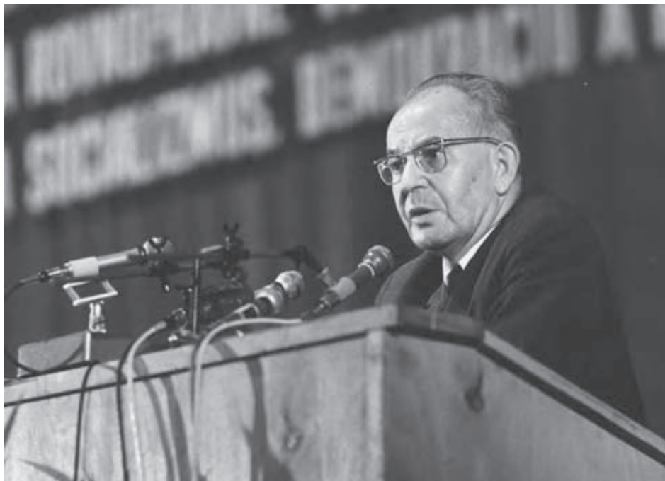
Gustáv Husák na mimoriadnom zjazde KSS.

Bratislava, pouličná protiokupačná ľudová tvorivosť.