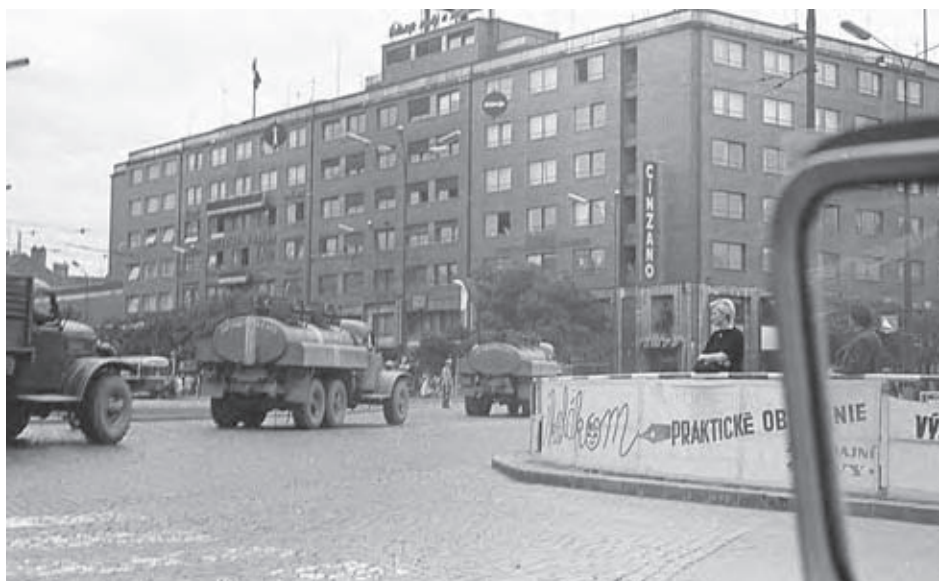
Po okupácii. Na začiatku Námestia SNP v Bratislave.