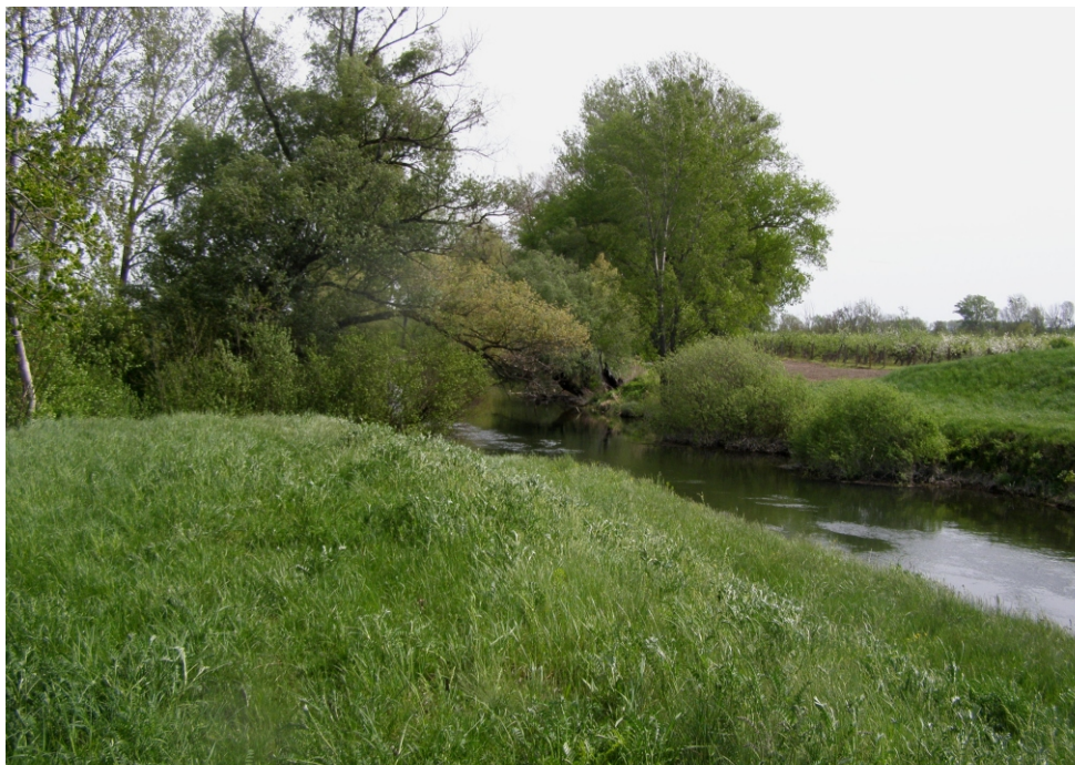
Povodie Malého Dunaja v katastri obce Topoľníky, kde došlo v roku 1945 k zavraždeniu skupiny Rómov z Hurbanova. (2013)