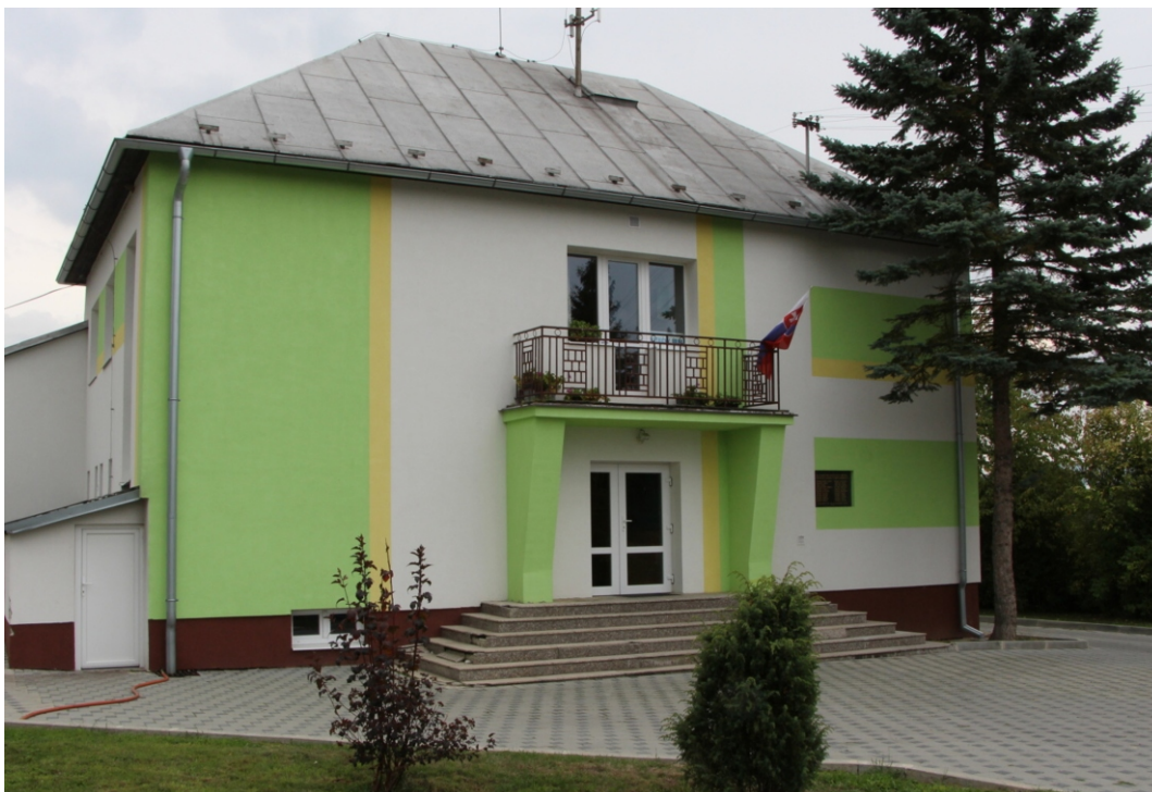
Na budove Obecného úradu v Dúbravách je od roku 1975 pamätná tabuľa s menami pätnástich zavraždených Rómov. (2014)