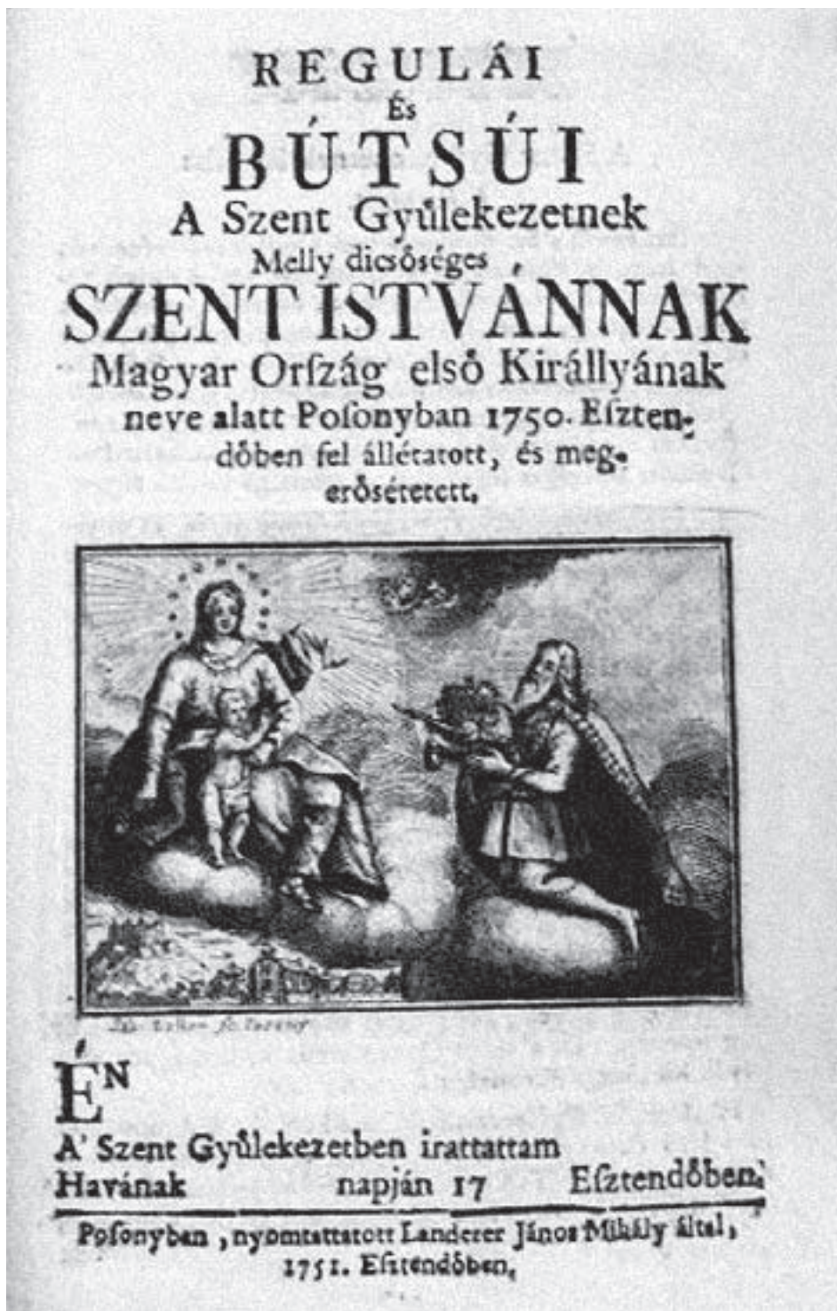
Obr. č. 2 – Stanovy Bratstva sv. Štefana založeného v Bratislave v roku 1749.