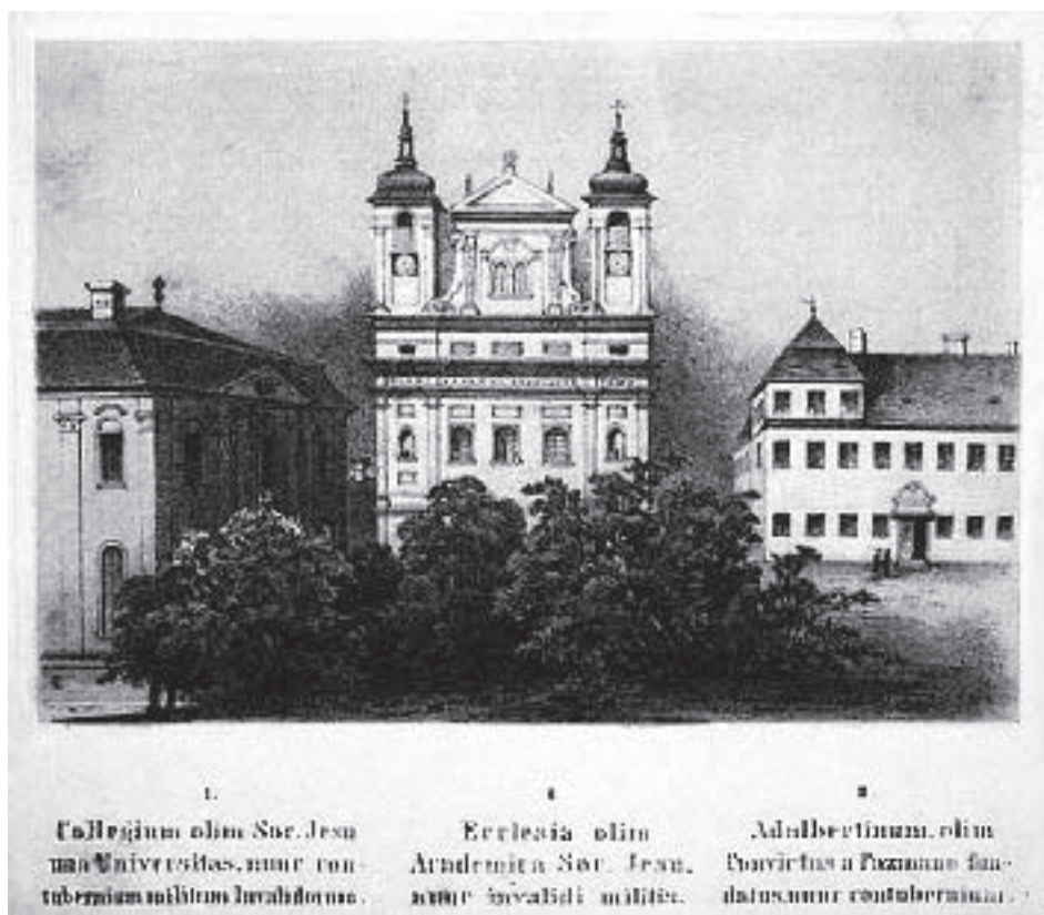
Obr. č. 3 – Konvikt sv. Adalberta v Trnave.