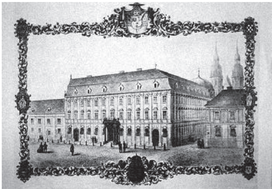
Obr. č. 4 – Šľachtický konvikt v Trnave. (Prevzaté z knihy Š. Ručka Trnava čili historicko-miestopisný nástin. Skalica 1868).