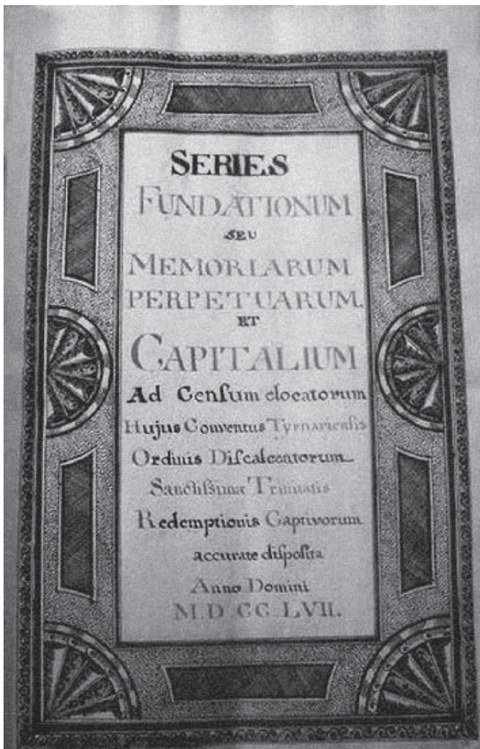
Obr. č. 13 – Titulná strana z knihy fundácií trnavského kláštora trinitárov.