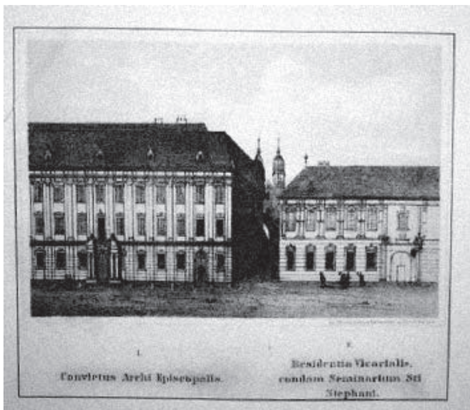
Obr. č. 8 – Seminár sv. Štefana v Trnave. (Prevzaté z knihy Š. Ručka Trnava čili historicko-miestopisný nástin. Skalica 1868).